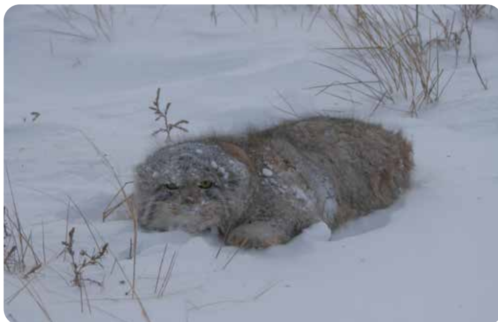
Chat manul ( Otocolobus manul ).