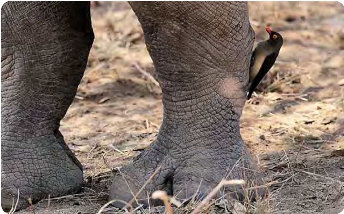
Rhinocéros blanc ( Ceratotherium simum ).

Les rhinocéros blancs ( Ceratotherium simum ) et les rhinocéros noirs ( Diceros bicornis ) d'Afrique sont inscrits en Annexe I de la CITES sauf les populations de rhinocéros blancs de l'Eswatini et d'Afrique du Sud inscrites en Annexe II pour les animaux vivants et les trophées de chasse.