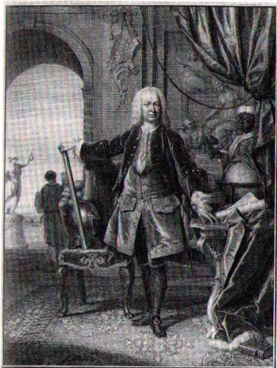
GUSTAAF WILLEM BARON VAN IMHOFF. GOUVERNEUR GENEERAAL VAN NEERL. INDIE. AET. XXXIX.