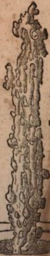
Catarrhus Elephantanti lapidescens. 6.