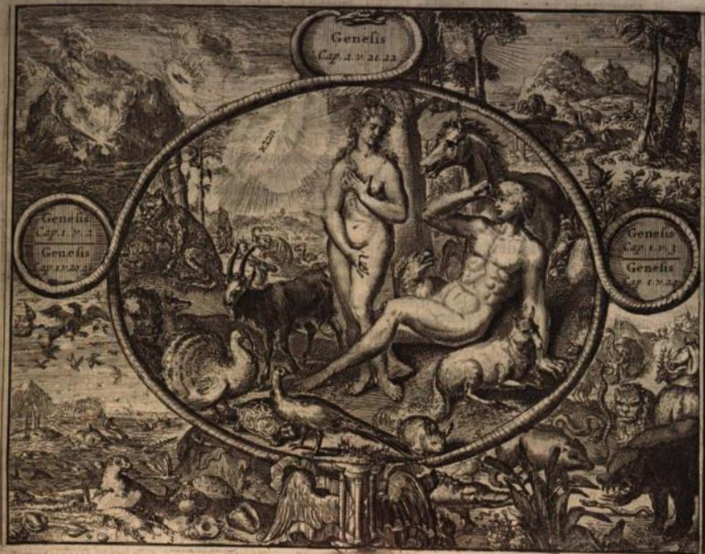
Mr. A. ALEWYNS VERKLAAR. OVER AFBEELD. III. 1 Oneyndig Weezen scheidt de Waereld, 't groot Heel-al, § 't Gevogelt in de Lucht, de Vijschen in den Stroom, De Starren, Zon en Maan, 't Gebloemt langs Berg en Dal, § Maakt Adam uit de kley, en Heva in Adams Droom, Het bladerryk, Geboomt, Gewaschen, Kruid en Dieren, § En geeft hem d'Oppermacht om 't Aardryk te bestieren.