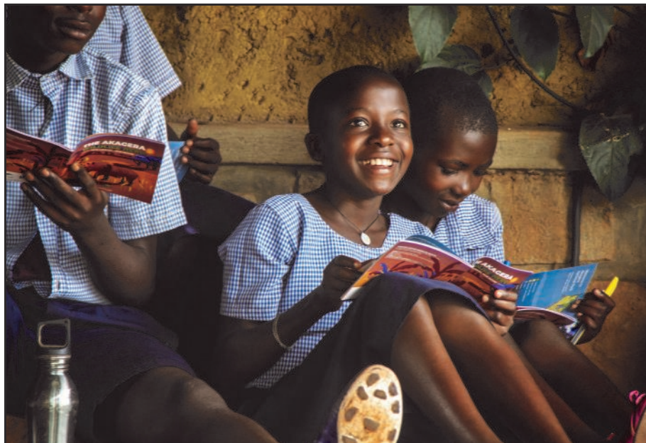
Děti z komunit v okolí národního parku Akagera při vzdělávacích programech, které byly vytvořeny pracovníky Safari Parku Dvůr Králové. (mg)