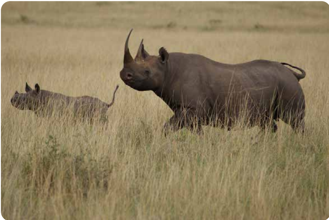
Rhinocéros noirs ( Diceros bicornis ).

Saisie dans le faux compartiment d'une caisse en bois en provenance de l'Angola de 2 cornes de rhinocéros coupées en 13 sections, d'un poids total de 10 kg et d'une valeur globale de 600.000 € soit 63.100 US$/kg. Il n'y a plus de rhinocéros en Angola Portugal Posts English, 22 juillet 2022. 34