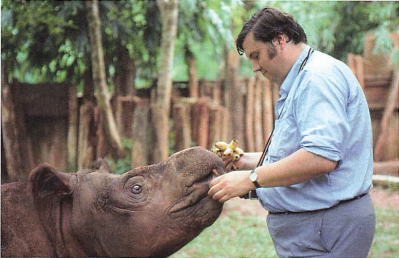
Hautnahe Begegnung mit dem von der Ausrottung bedrohten Sumatra-Nashorn.