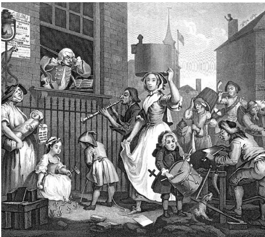
'The Enraged Musician'. Ets van William Hogarth (1741)

Het is een arbeidsintensief werk om in de registers aanvragen van rondtrekkende entertainers te vinden. Om op zoek te gaan naar relevante zaken is het raadzaam om het register van 'decreten' te overlopen en dan op approximatieve datum in het register van de 'protocols' de beraadslaging van de desbetreffende