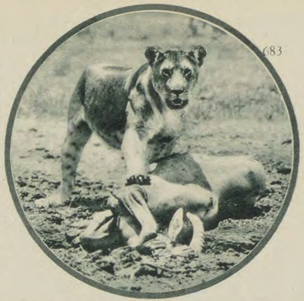
De wet van de wildernis: de zwakkere verliest het tegen den sterkere — en wordt verslonden.

den grond terecht, de cobra lag onder mij. Ik voelde het lichaam wringen onder het mijne, en bij iederen wong drukte ik sterker naar beneden.