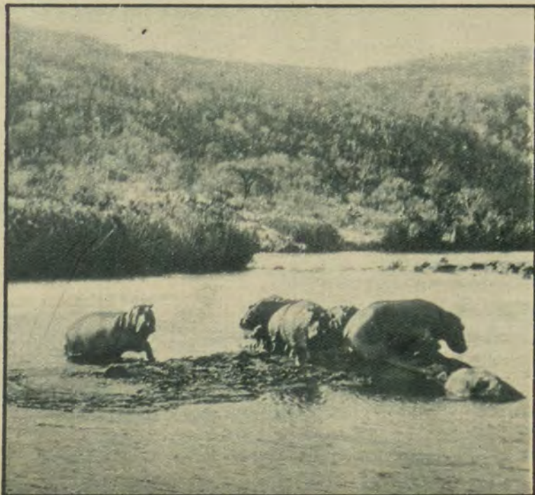
Nijlpaarden in de Komati (Transvaal), die ondanks hun waakzaamheid door den fotograaf verrast werden.

speciaal op de paden der dieren, en tegen de zonderlingste moeilijkheden opgewassen zijn.