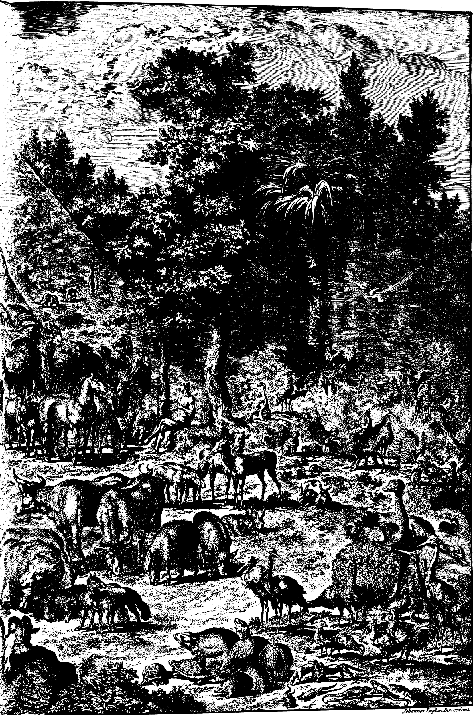
Adam donne les Noms à tous les Animaux. Genèse II v. 29.