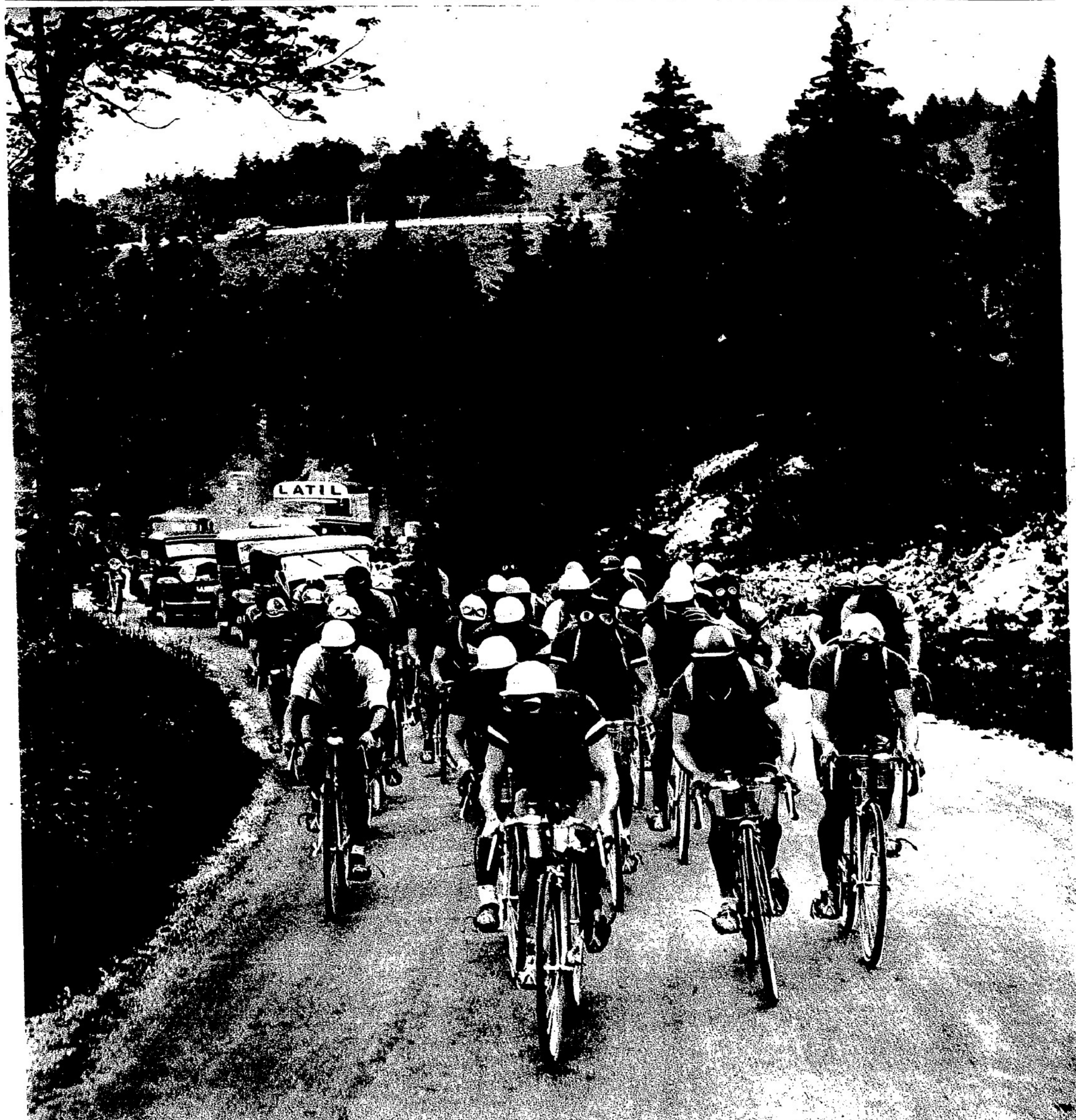
TOUR DE FRANCE CYCLISTE. — Les coureurs, sous la conduite d'Archambaud, vaillant leader actuel, de Buchi et de Grandi, escaladent aisément le col de la Faucille (photo n° 8 du Jeu de la plus Belle Photo).