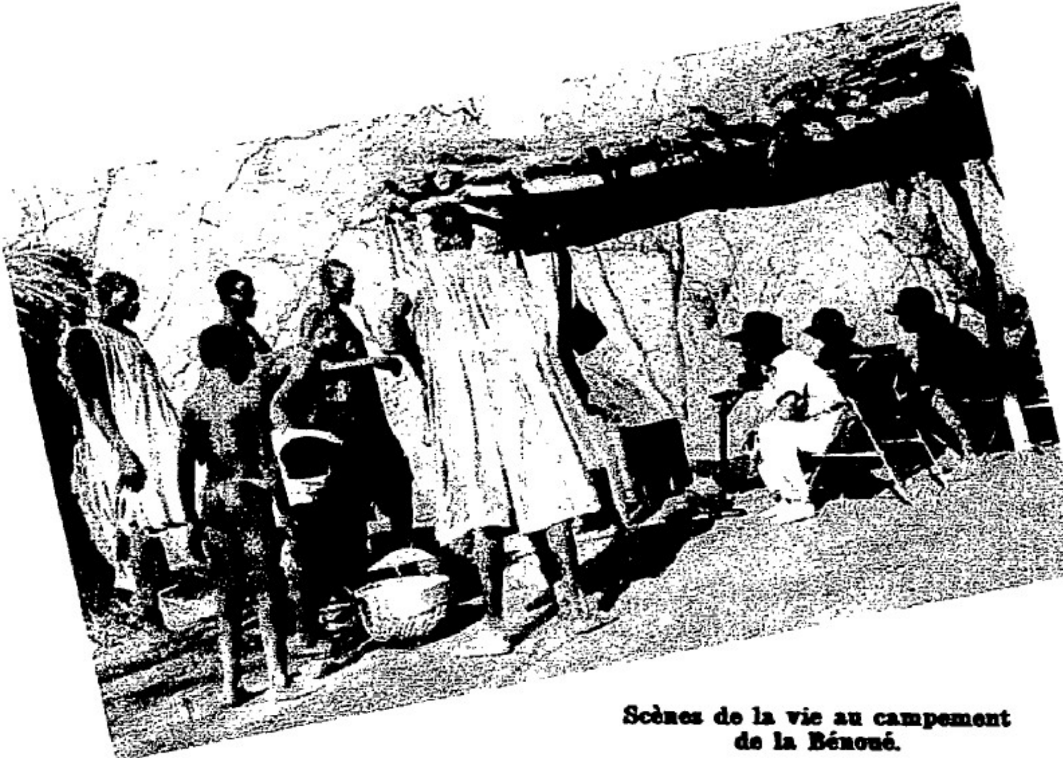
Scènes de la vie au campement de la Bénoué.