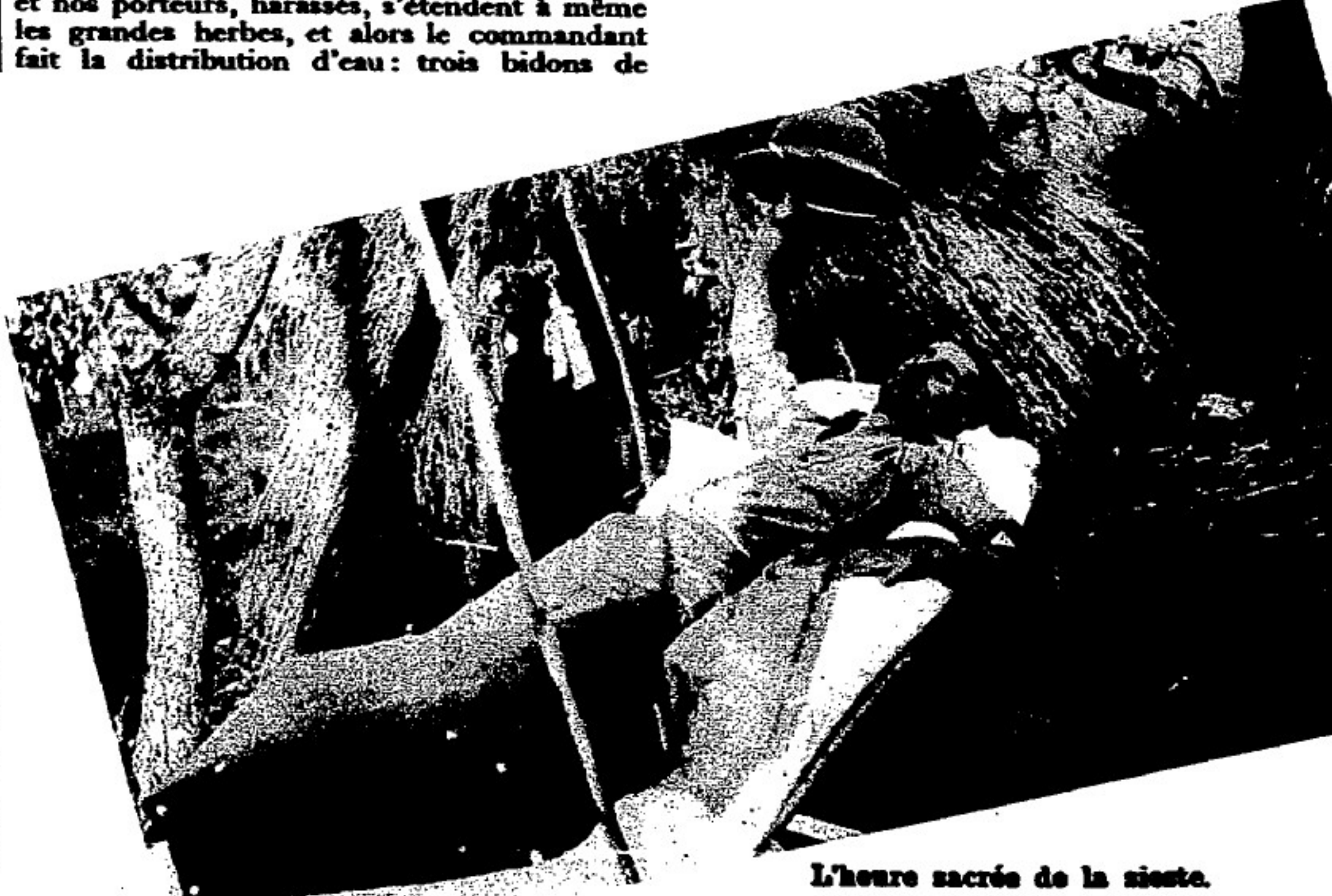
L'heure sacrée de la sieste.

vingt litres chacun sont ouverts et c'est la distribution généreuse. Puis, nous profitons de cette halte pour goûter à nos gamelles, du modèle militaire, une belle tranche de viande de rhinocéros posée sur un canapé de riz indigène, puis une boîte de fruits au jus, fabriquée dans quelque ville anglo-saxonne de la côte ouest de l'Angleterre. Tandis que nous nous reposons un quart d'heure, nos deux pisteurs vont poursuivre leurs recherches. Au bout de ce laps de temps, ne les voyant pas revenir, nous voici debout de nouveau et reprenant notre active poursuite. Elle nous conduit dans la région de la haute brousse, où, partout, on trouve les traces du passage récent de la bête que nous harcelons. Ces traces nous indiquent qu'elle a même essayé de se coucher. Elle doit être exténuée. A 1 h. 30, nous trouvons un trou d'eau de cinq mètres sur quatre, un de ces margouillia boueux ressemblant à ceux que l'on trouve dans certaines forêts du Nord de la Pologne et dont la vase paraissait avoir été fraîchement remuée. L'animal, harassé, avait sans doute voulu y rafraîchir son corps. Il était alors 1 h. 30 et, depuis 5 h. 30 du matin, nous ne lui avions pas