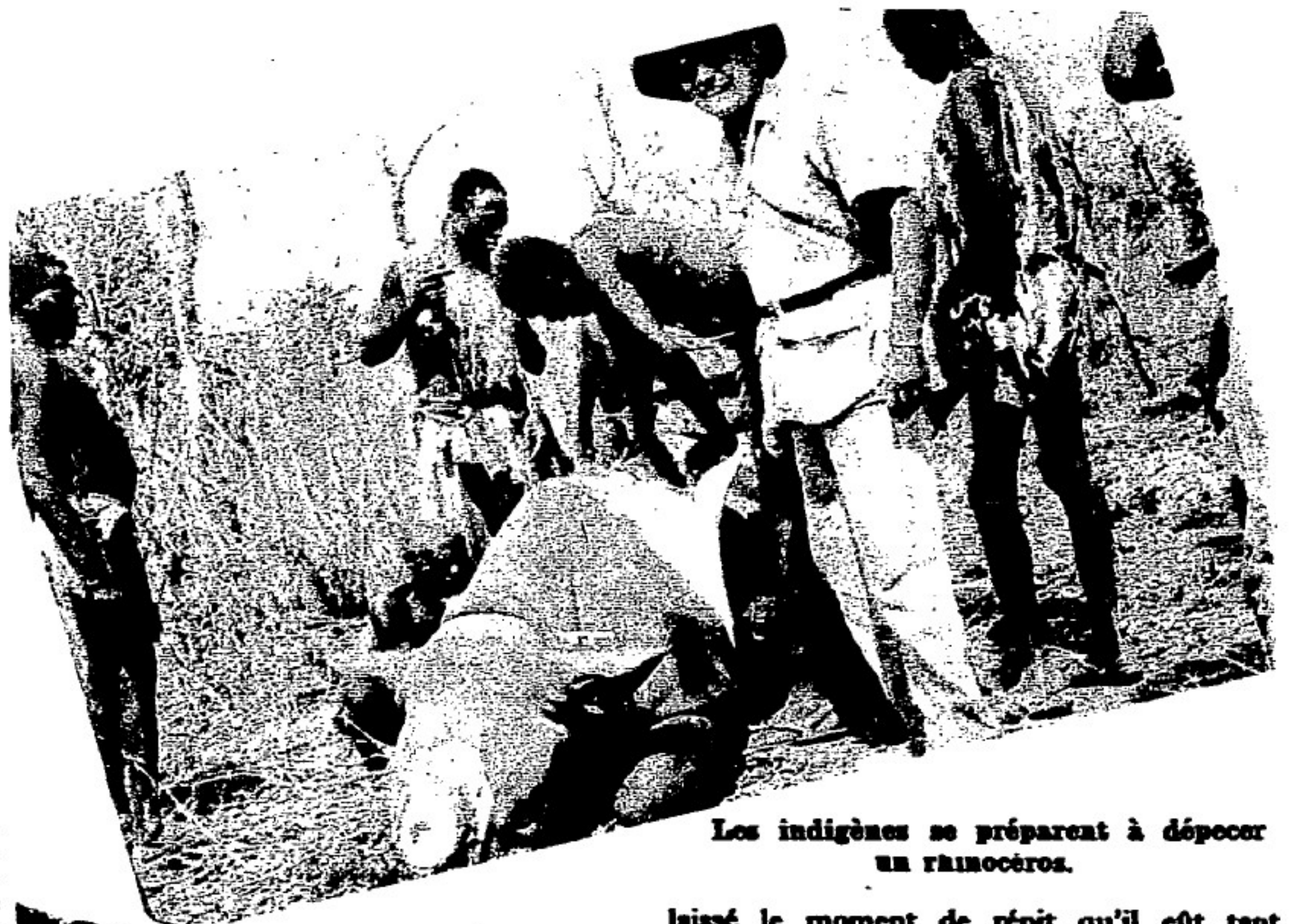
Les indigènes se préparent à dépecer un rhinocéros.

Dans une épreuve de cross-country, on ne s'arrête pas parce que l'on se déchire aux ronces des buissons, pas plus qu'on interrompt une partie de tennis parce qu'il fait une température tropicale, ou parce qu'on manque d'eau potable. Ce sont là les aléas du sport... Nous avions parcouru plus de vingt kilomètres ; le rhinocéros nous avait entraînés dans sa marche, nous sentant, depuis six heures du matin (5 h. 30 exactement), sur ses talons et ne se décidant pas à se coucher. Et cependant, si nous peinions, nos porteurs surtout, l'animal qui avait à porter sur ses quatre courtes jambes