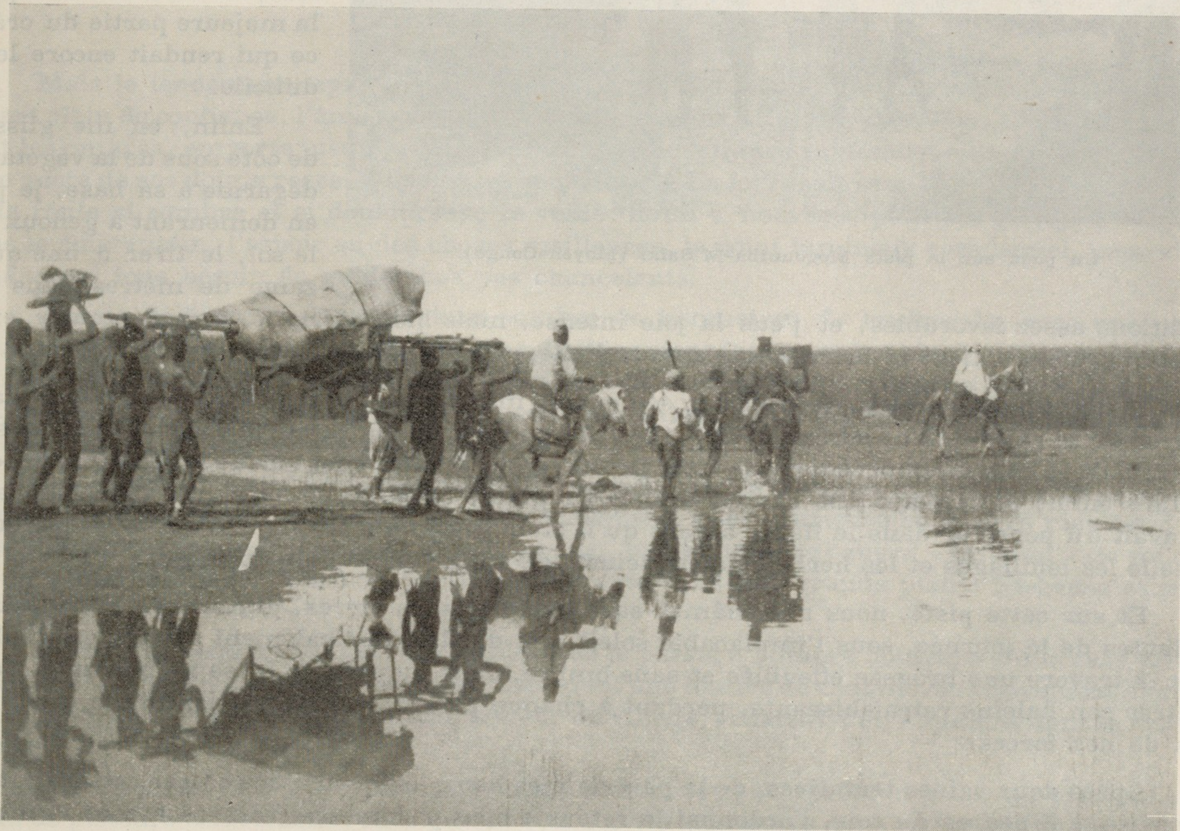
Passage d'un gué sur le Logone (Mayo-Kebbi).

En me voyant ne pas revenir, le plus courageux de mes hommes s'aventure à ma suite dans l'étroit couloir où j'étais demeuré, mais une branche sèche se cassa avec bruit sous ses