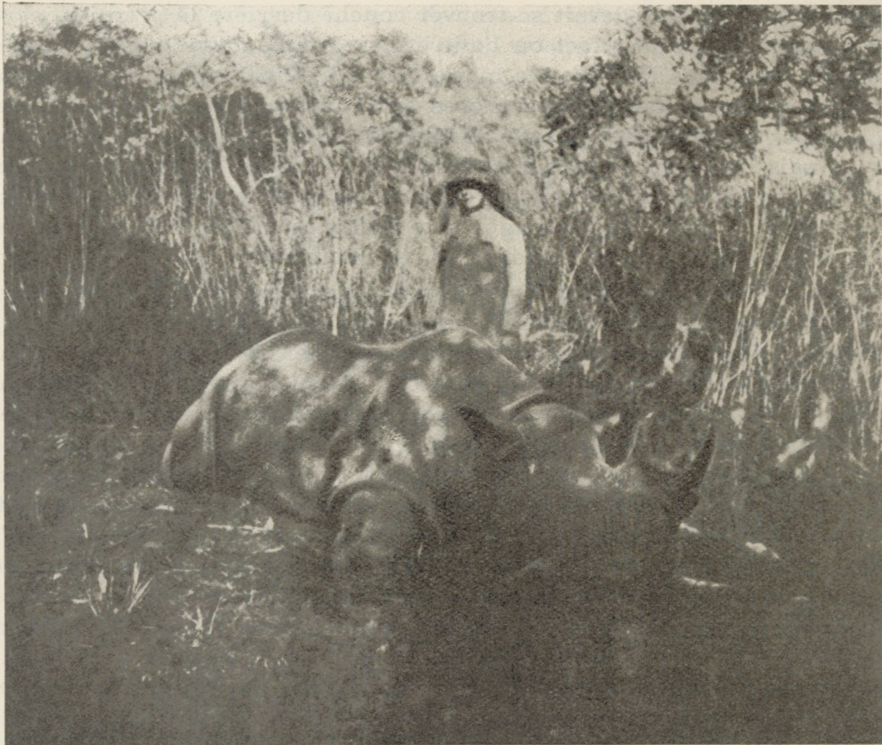
Un rhinocéros adulte tué dans la région de Bonjor.