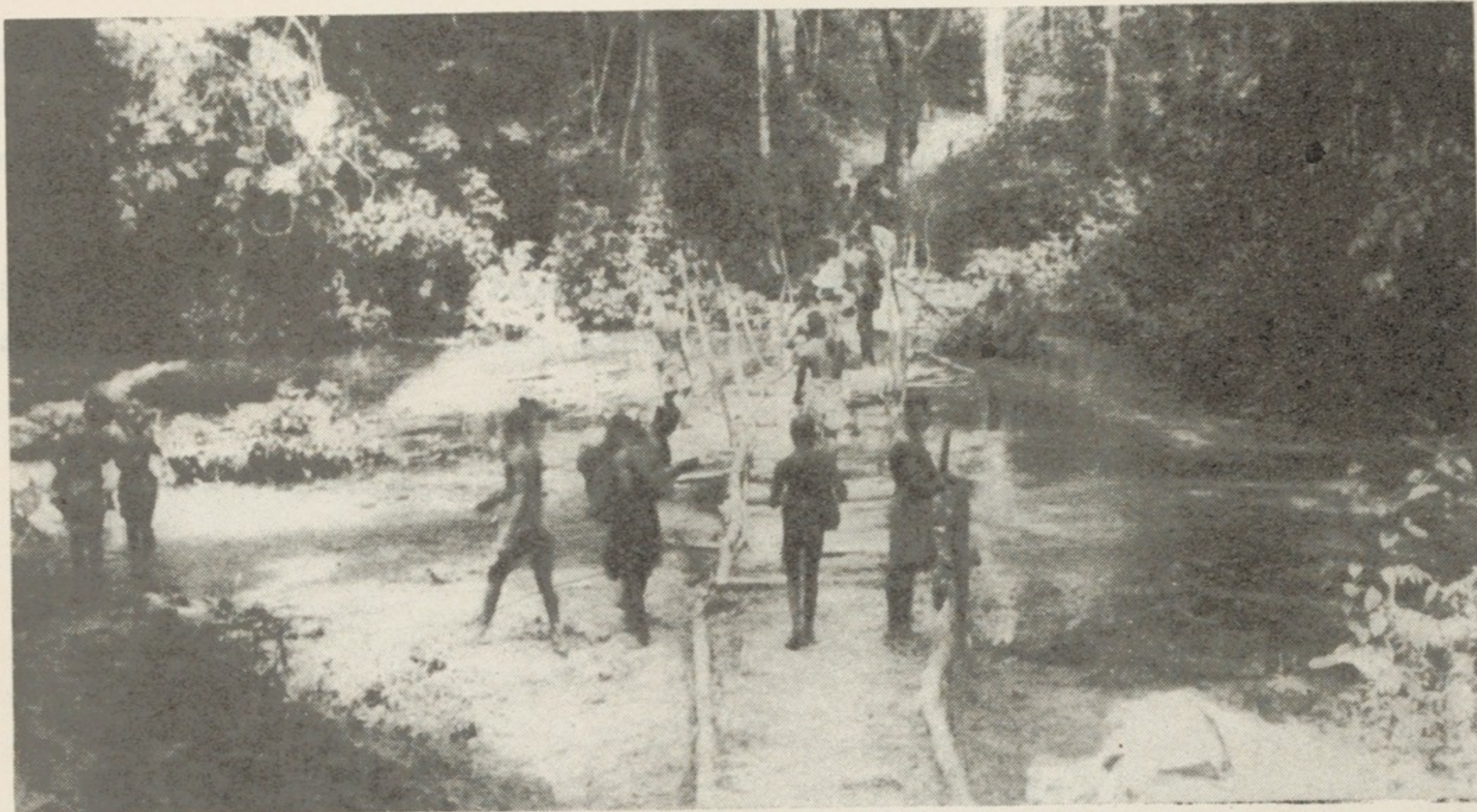
Un pont sur la piste Mogoumba-M'Baïki (Moyen-Congo).

vent, de les entendre tout à coup s'enfuir bruyamment. Mais il n'en fut rien, et après d'assez longues circonvolutions, j'en retrouvai un immobile dans le fourré, et cette fois faisant face, les défenses masquant la majeure partie du crâne, ce qui rendait encore le tir difficile.