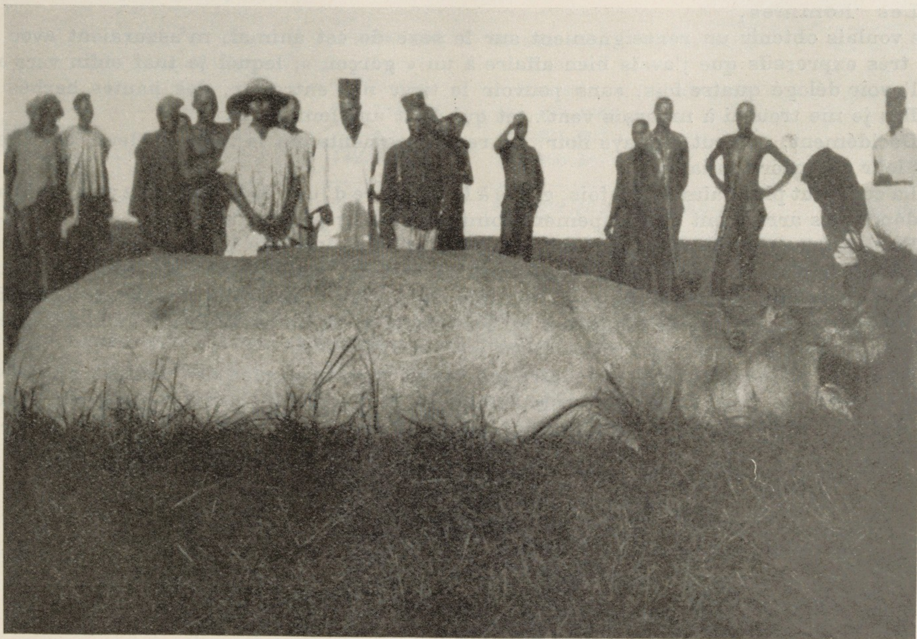
Un hippopotame tué sur les bords du Ba-Isli.