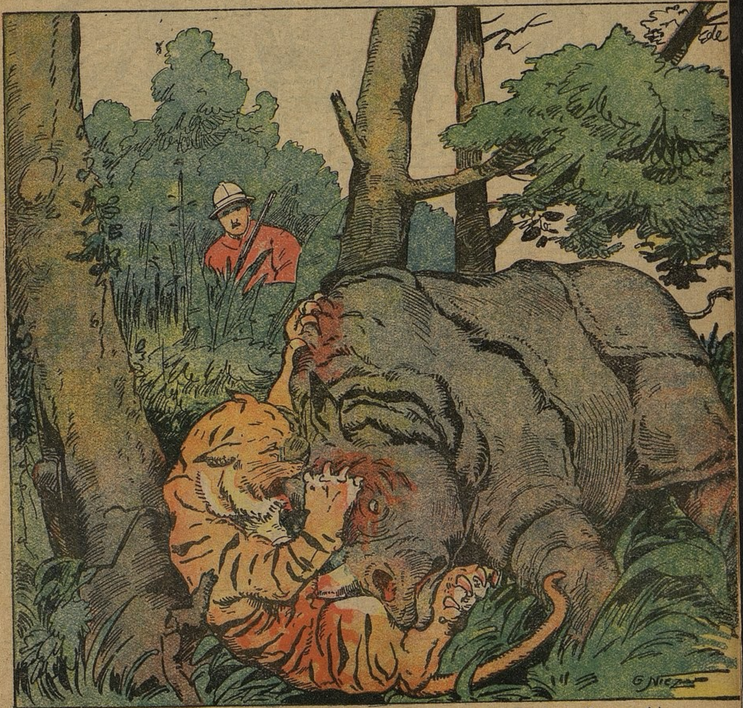
La terrible corne du rhinocéros pénètre dans la poitrine du tigre. (Lire page 6.)