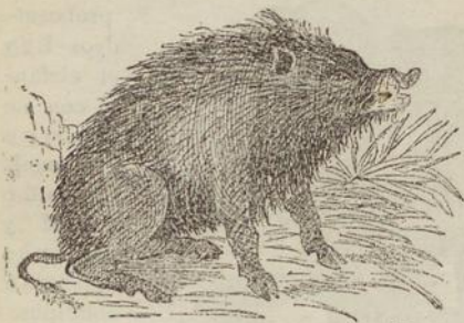
Fig. 38. JABALÍ.

poco hueso y que se ceba siendo jóven y en poco tiempo. La segunda está más extendida por otras provincias,