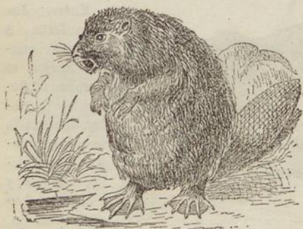
Fig. 35. CASTOR.

Corresponden á este orden las ardillas , ratones , castor , conejo , liebre , puerco espín , la marmota , el liron , etc.