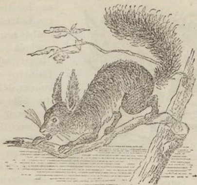
Fig. 34. ARDILLA.

Roedores. —Son mamíferos con uñas, y sistema