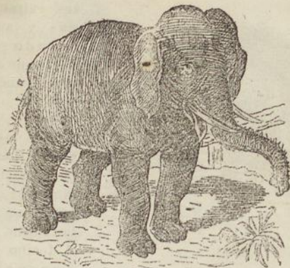
Fig. 36. ELEFANTE.

los proboscídeos, paquidermos ordinarios, y solípedos. Son animales de cuero duro y grueso, unglados ó que tienen el pié encerrado en una uña grande, pesados y súcios á excepcion de los solípedos.