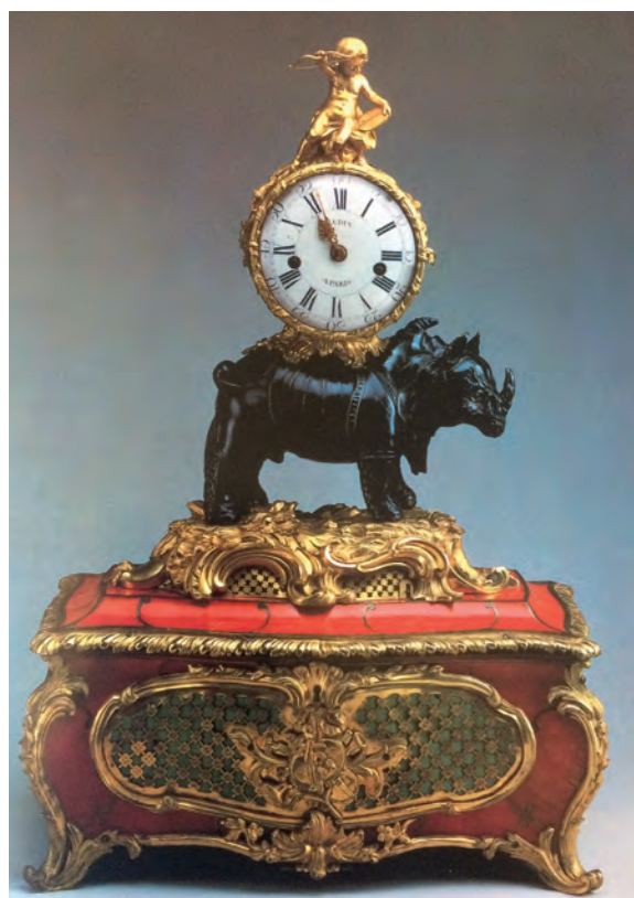
Afb. 4: "Dürer"neushoornklok (circa 1750), gesigneerd Gudin a Paris, uit Die Französische Bronzeuhr , Elke Niehüser

Halverwege de 18de eeuw kwamen er neushoornklokken op de markt. Er zijn twee typen klokken gemaakt. De eerste toont een neushoorn, zoals afgebeeld