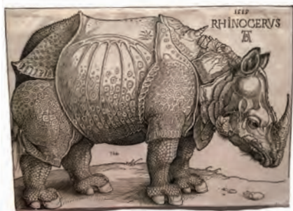
Afb. 2: The Rhinoceros (1515), Albrecht Dürer; houtsnede in 2013 geveild voor EUR 650.000,00

Voorafgaand aan de Clara tour was de neushoorn niet geheel onbekend. In 1515 (ruim 200 jaar eerder!) werd een neushoorn in Lissabon aan land gebracht en ter gelegenheid daarvan door Albrecht Dürer op een prent afgebeeld (Afb. 2). Het dier werd geschonken aan de Paus en