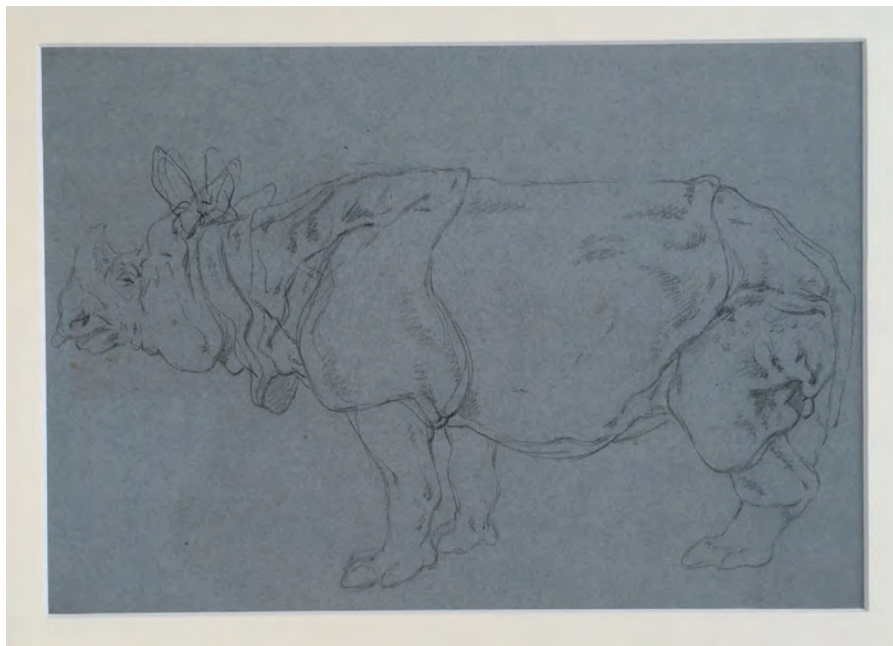
Afb. 3: Clara vanaf de linkerzijde (1748), zwart krijt op blauw papier van Johann Elias Ridinger, privé collectie