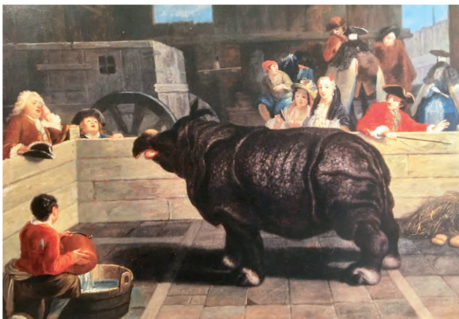
Afb. 1: Clara tentoongesteld voor publiek (circa 1751), schilderij uit Pietro Longhi school.