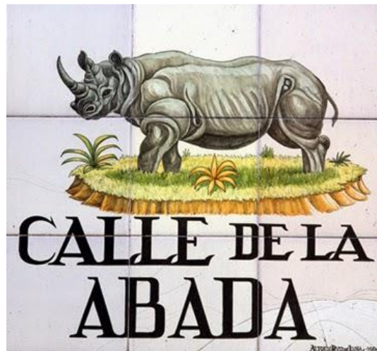
Placa de la calle de la Abada.

Cuenta la tradición que la madrileña calle de la abada recibe su nombre por un suceso ocurrido en el lugar en el siglo XVI. Fue durante el reinado de Felipe II cuando unos feriantes portugueses llegaron a Madrid con una abada o rinoceronte, un animal desconocido en Europa, para exhibirlo al público. Montaron su campamento en las eras del priorato de San Martín, en un terreno hoy delimitado por la calle Preciados, la Gran Vía y la plaza del Carmen. Los madrileños acudían en multitud al lugar y pagaban dos maravedíes por entrar en la barraca o tienda y contemplar al fabuloso animal, al que acosaban con gritos y silbidos mientras los portugueses tocaban tambores y dulzainas.