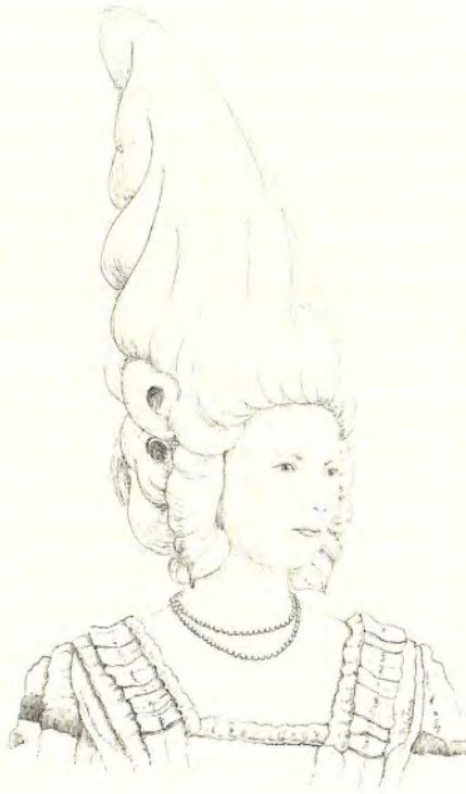
In Parijs beïnvloedde Clara de mode en veroorzaakte een rage. De dames droegen 'Coiffures à la Rhinoceros'

In Parijs beïnvloedde de neushoorn de mode en veroorzaakte een rage. Er werden jurken au Rhinoceros gemaakt en een creatieve kapper moet de coiffure à la Rhinoceros hebben bedacht, want er liepen dames rond met een kapsel dat uit een hoorn, uitgebeeld door middel van een veelkleurige veer, en een lint als staart bestond 8 en misschien wel als een hoge pruik in