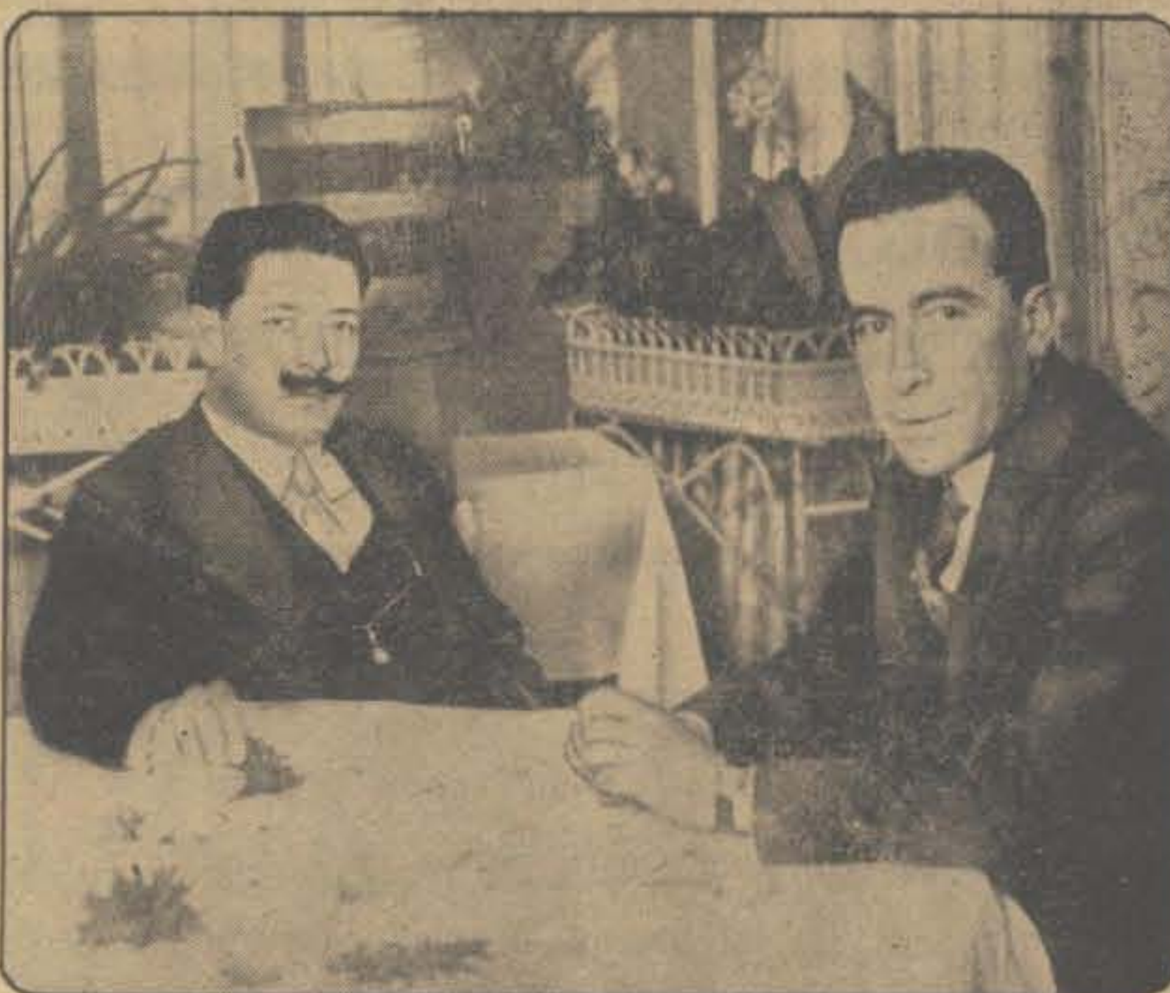
DE OPSTAND IN MEXICO. — De generaals Gomez (links) en Serrano tijdens de conferentie, waarin zij hun krachten verbonden om de candidatuur van generaal Obregon voor den Mexicaanschen presidentszetel te bestrijden. Toen zij kort daarna tegen de regering in opstand kwamen, werden beiden gevangen genomen en zonder vorm van proces geëxecuteerd.