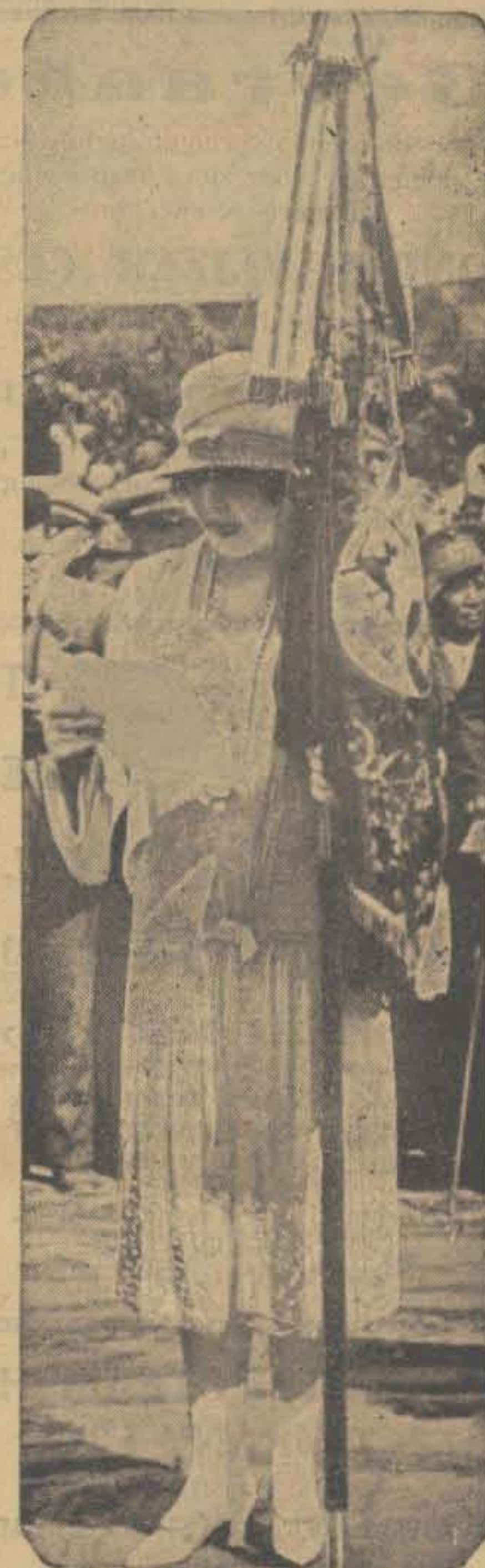
HET SPAANSCH KONINGSPAAR BRACHT EEN BEZOEK AAN MAROKO, waar in Ceuta Koningin Victoria aan het Vreemdelingenlegioen een nieuw vaandel overhandigde. — De Koningin spreekt met het vaandel in de hand een rede uit.