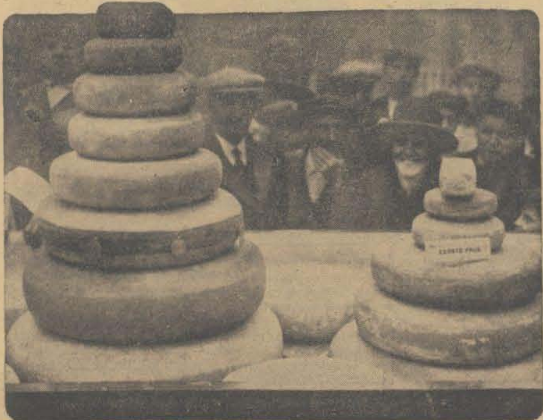
OP DEN FEESTMARKTDAG TE GOUDA, die gehouden werd om te trachten naast de bestaande varkensmarkt ook een runderen- en kalverenmarkt te stichten, trok de kaasstentoonstelling zeer de aandacht. — Eenige eerste-prijswinnaars worden door het publiek bewonderd.