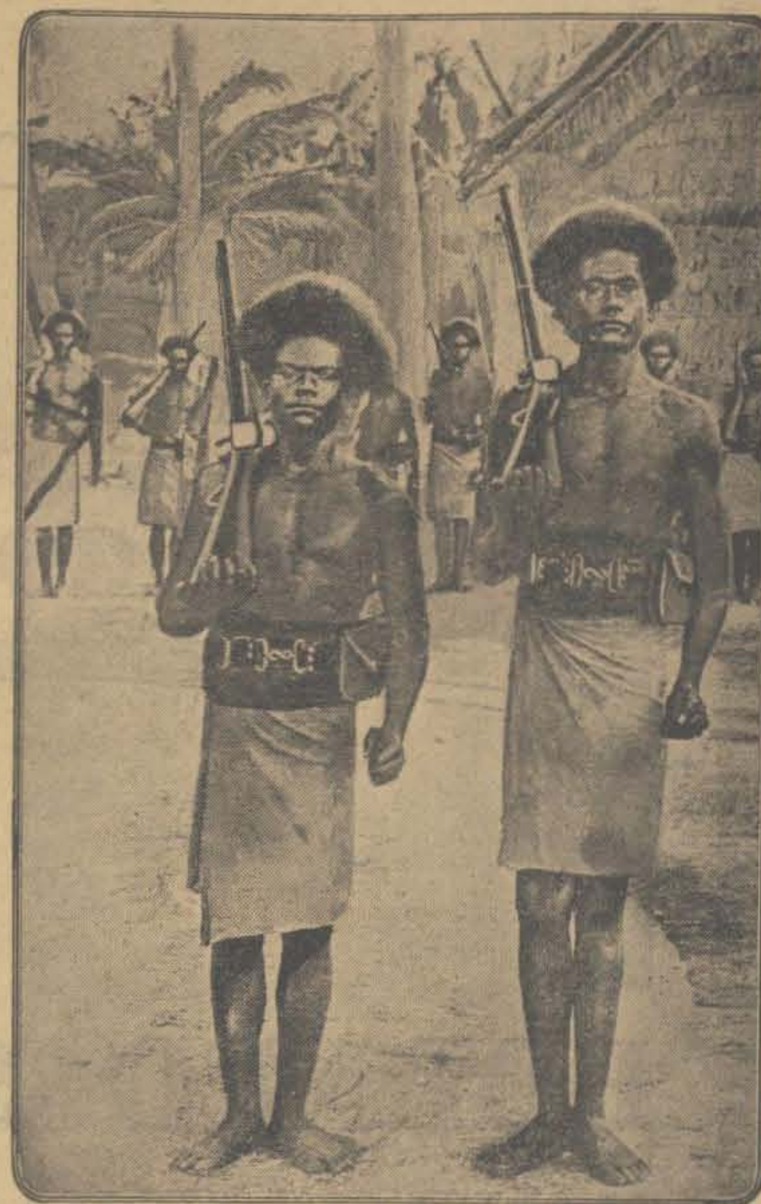
OPSTAND OP DE SALOMON-EILANDEN. — De Australische regering heeft een aantal oorlogsschepen en een troepenafdeeling naar de Salomon-eilanden gezonden, waar herhaaldelijk blanken slachtoffer worden van onlusten onder de inboorlingen. — Twee „inspecteurs” der inlandsche politie op de Salomon-eilanden.