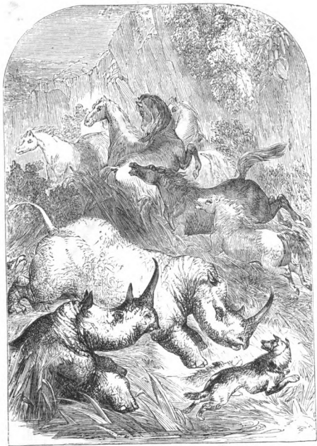
Charge des rhinocéros.