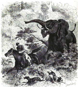
Zagt te paard op den olifant.

physiologische wet gebleken, dat vijfmalen dit ontwikkelingstijperk overeenkomt met het gemiddelde maximum van aller levensduur; dat is alzoo 10 jaren voor den hond, 25 voor het paard, 100 voor den mensch, 150 voor den olifant. En wat deze laatste aangaat, heeft de ondervinding bij tansse olifanten dit gevoelen bevestigd.