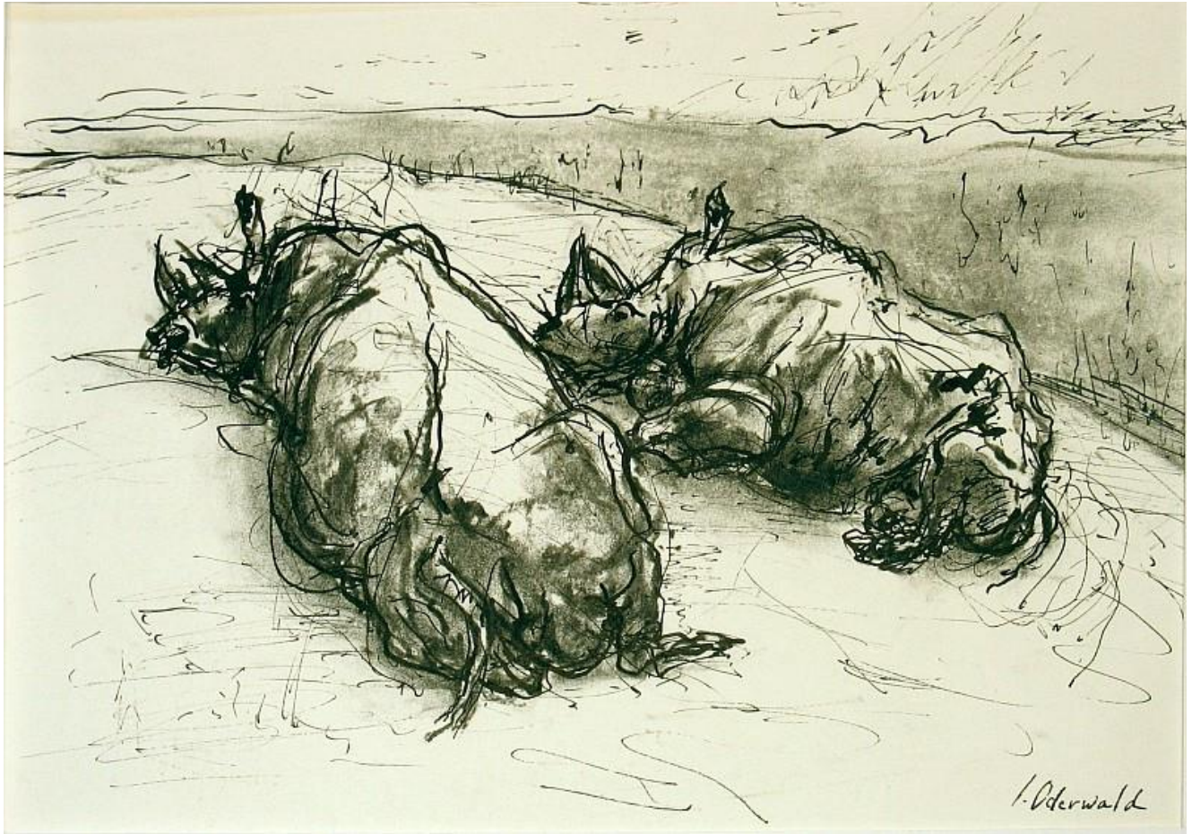
"Twee liggende neushoorns in vlakte / Dos rinoceronte yacen en un llano / Two rhinos lying in plain" Pluma y carboncillo / pen and charcoal.

Más imágenes e información (desgraciadamente sólo en holandés) en el sitio web de la artista .