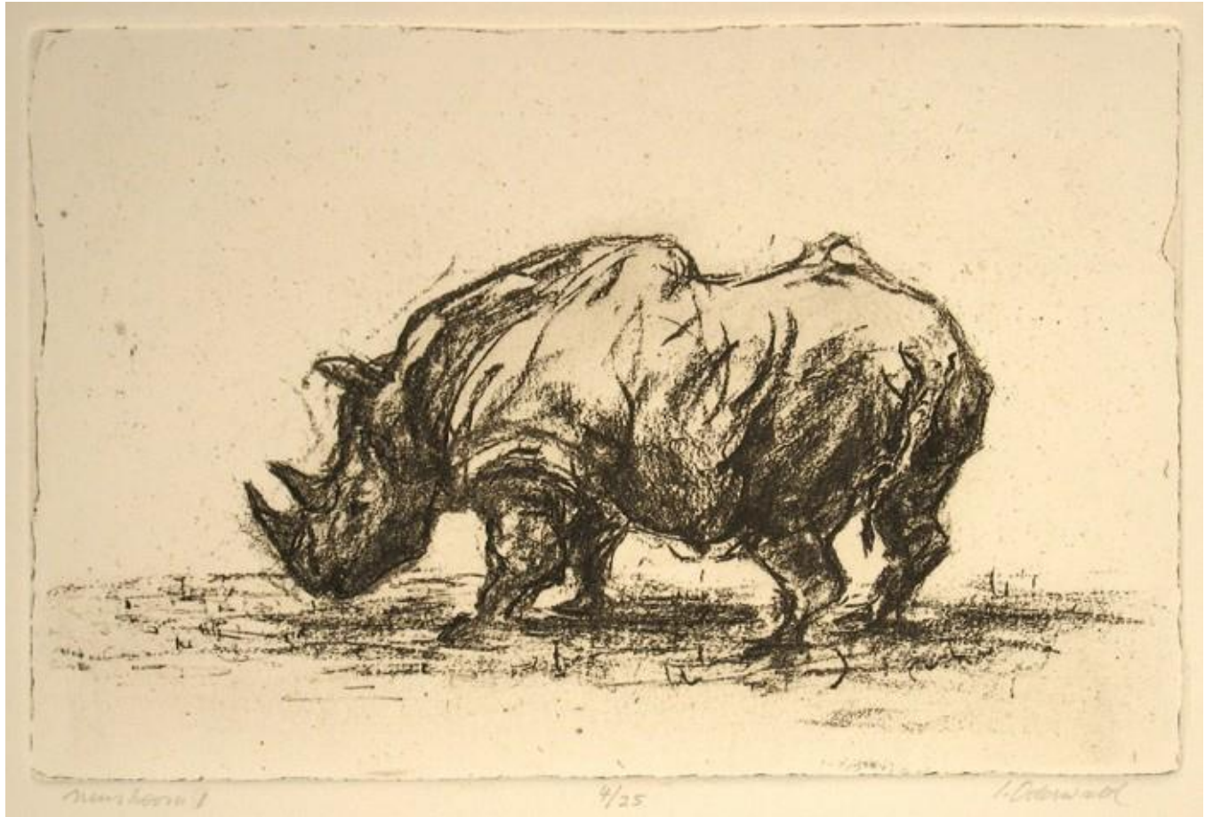
"Neushoorn I / Rinoceronte I / Rhino I", grabado / etching, 4/25