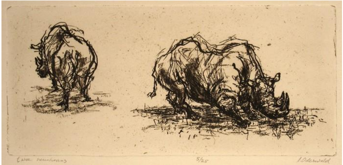
"Twee neushoorns / Dos rinocerontes / Two Rhinos ", huecograbado, gravure, 5/25

Her work encompasses different techniques of engraving, painting, drawing in charcoal and ink, even mixed media techniques developed by the artist, and her subjects range from musicians and animals to nudes, landscapes and abstract works. The alternation of themes and techniques gives her work a spontaneous character of permanent search. Ingeborg studied at the Rietveld Academy and her work is represented in the Stedelijk Museum, institutions, companies and private collections. She is a member of several institutions, including the Dutch Society of Illustrators.