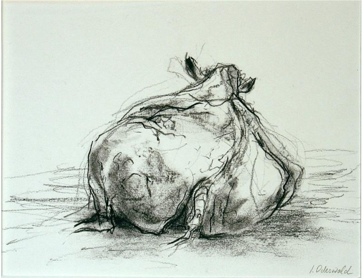
"Neushoorn, op de rug gezien / Rinoceronte, vista posterior / Rhino, back view" Dibujo / drawing, tiza y carboncillo / chalk and charcoal

Ingeborg Oderwald is a Dutch artist born in 1932, based in Amstelveen -in the neighborhood of Amsterdam. As she wrote me, her activity is "working hard: drawing, etching, painting. I mostly draw in winter musicians at little concerts held in our opera-house (Muziektheater Amsterdam)".