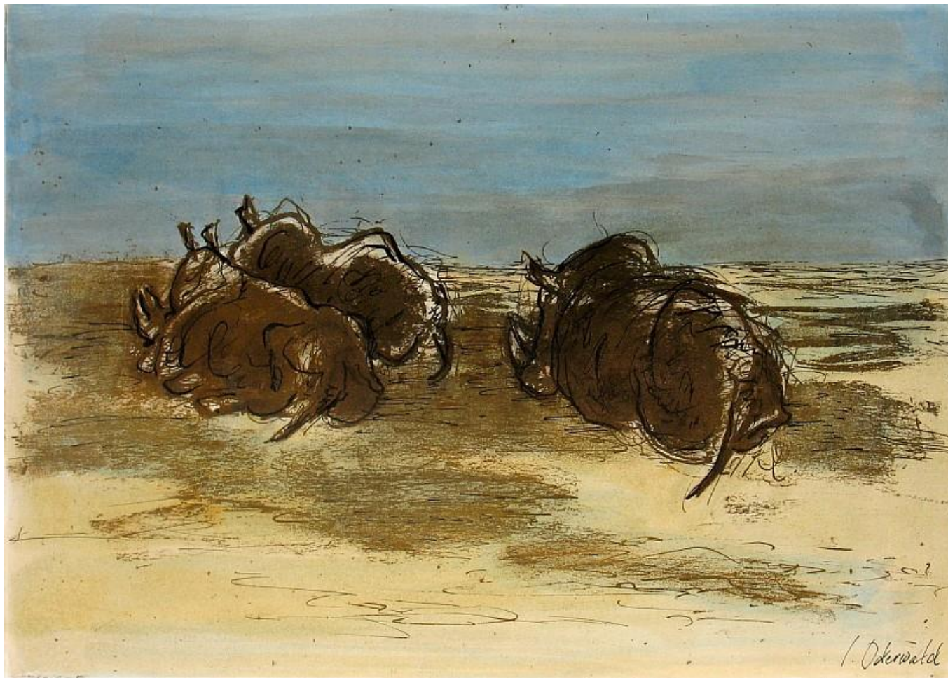
"Neushoorns in de vlakte, olieverf en inkt / Rinocerontes en el llano, óleo y tinta / Rhinos in Plain. oil and ink "

Incluyo esta otra obra cuya imagen me ha remitido la artista. ¡Gracias otra vez! / I include this other work whose image has sent me the artist. Thanks again!