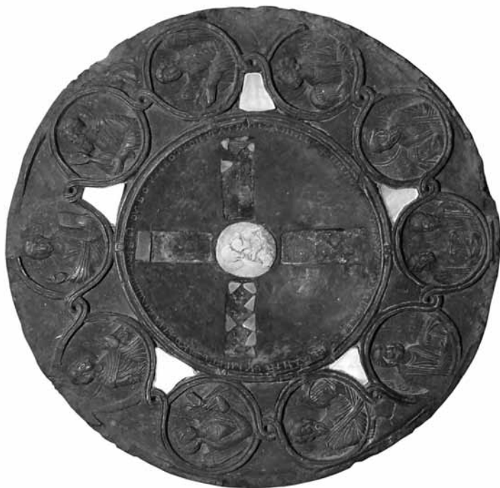
Вагопедски и хиландарски панагијар од рожине