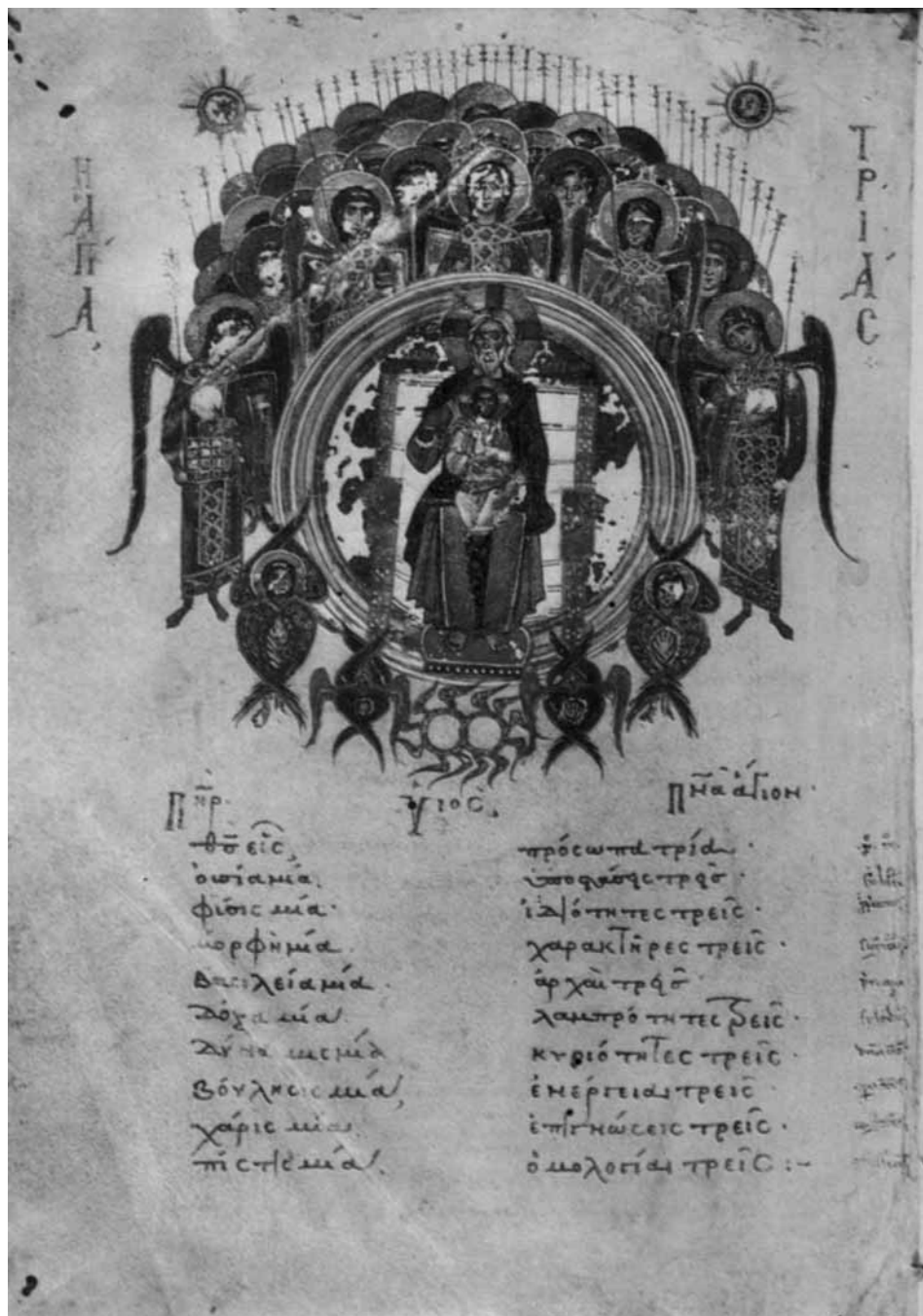
Света Троица, Национална библиотека, Беч (Suppl. gr. 52, fol. 1v)