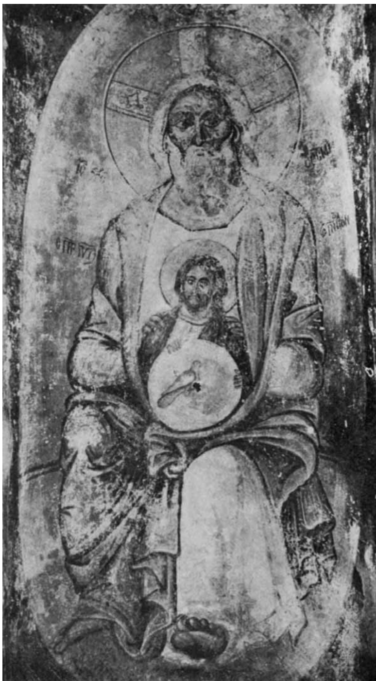
Света Тројица, Богородица Кубелидики, Костур