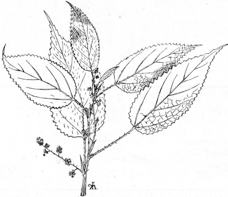
Afb. 5. Laportea evitata .

Het weer beloofde schitterend te worden, zoodat er kans bestond om nog een paar kiekjes te nemen. De dragers werden doorgezonden, en al spoedig bevond ik mij met mijn gids, door het oponthoud bij het fotografeeren, alleen in de eenzaamheid van het oerwoud, onder welks bekoring ik ook nu weer geraakte.