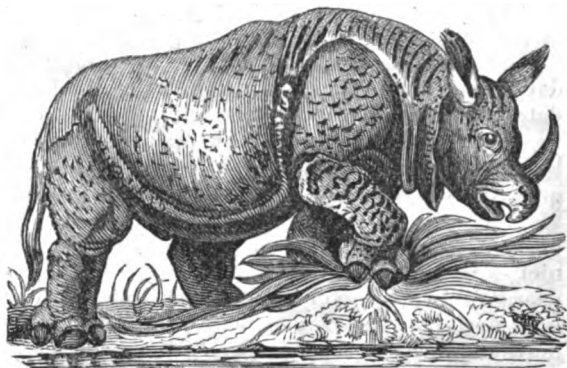
[De Rhinoceros of Neushoren.]

Tot de eerste soort behoort: de Rhinoceros Indicus of Asiaticus met veertien maaltanden in de onder- en bovenkaak, waarvan de onderste dubbel zijn; vier voortanden boven en onder, waarvan de onderste kegelvormig, de bovenste eenigzins gekwabd zijn, maar geene hoektanden. Hij woont in Oost-Indië, heeft aan het einde van de bovenlip eenen snuitachtigen, zeer beweegbaren haak, waarvan hij zich tot het aanvatten en opheffen van kleine dingen zeer behendig weet te bedienen, en eet kruiden en takken. Men heeft er in 1739 een uit Bengalen naar Londen gevoerd, welke reis omstreeks 1000 ponden sterling gekost heeft; hij was twee jaar oud, gebruikte dagelijks tot voedsel seven pond rijst, drie pond suiker en veel hooi en gras. De hoeveelheid drank was aanmerkelijk. Deze Rhinoceros houdt zich aan de oevers der rivieren en