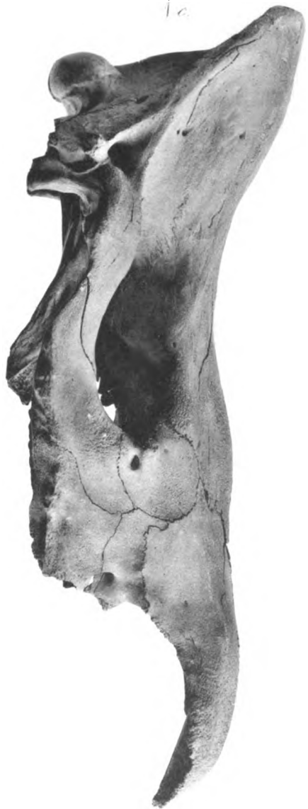
PLATE IV. Fossilized Skulls. 11. Dorsal view. 12. Lateral view.