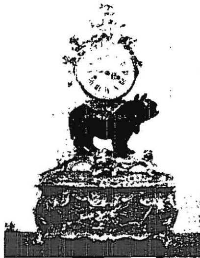
Clara als klok.

In Frankrijk waren exotische dieren vaak uurwerkdragers. Na het bezoek aan Versailles kreeg een neushoorn de tijd te dragen (het gaat hier overigens om monsterlijke sierstukken). Lodewijk XV gaf de schilder Oudry de opdracht een levensgroot portret van Clara te maken. Er werden - kleine - gravures van gemaakt. Die kwamen te-