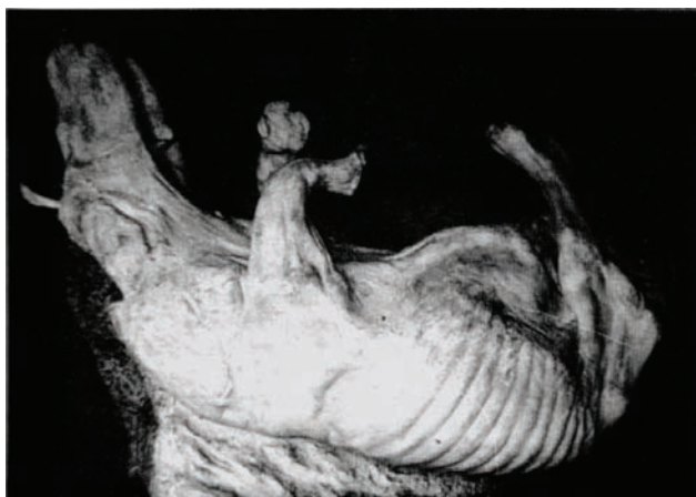
Рис. 1. Гіпсовий відбиток носорога у позиції його залягання у відкладах