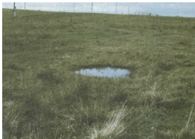
Рис. 2. Кратер грязьового вулкану