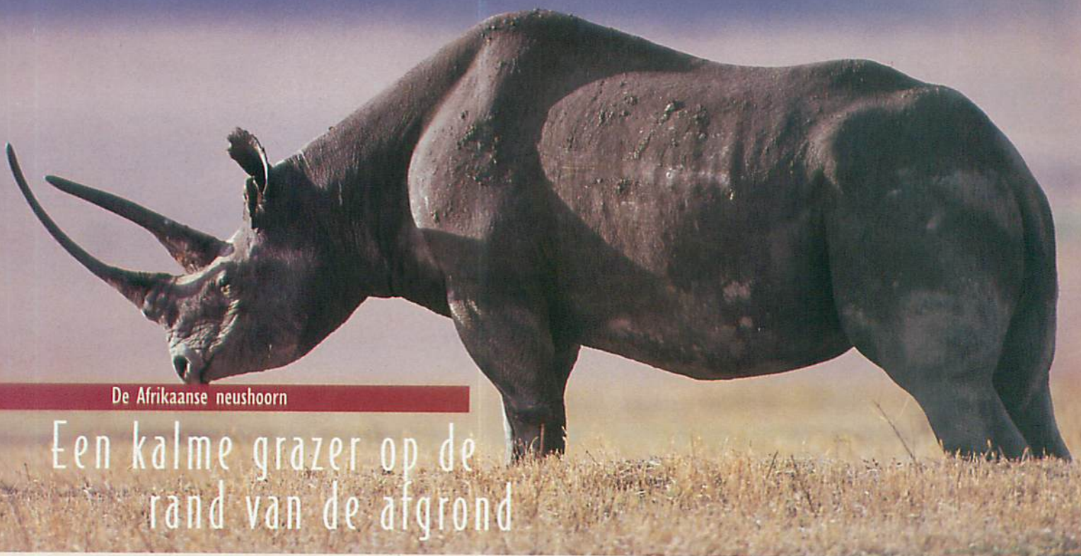
De Afrikaanse neushoorn