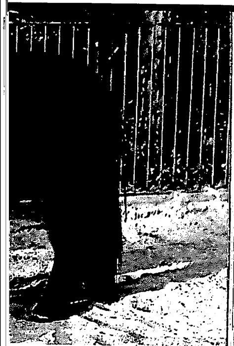
Netlandponystute zwei junge Hengste.