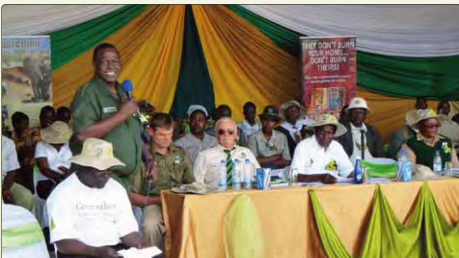
Offizielle Feierlichkeiten zum „Projektstart“ im August 2011.

Auch wenn durch die ausstehende Registrierung das Projektmanagement bislang umständlicher und aufwendiger war, haben wir in den letzten vier Jahren in Gonarezhou schon viel erreicht. Vor allem konnten wir die Ranger von Gonarezhou in ihrer Arbeit unterstützen und da-