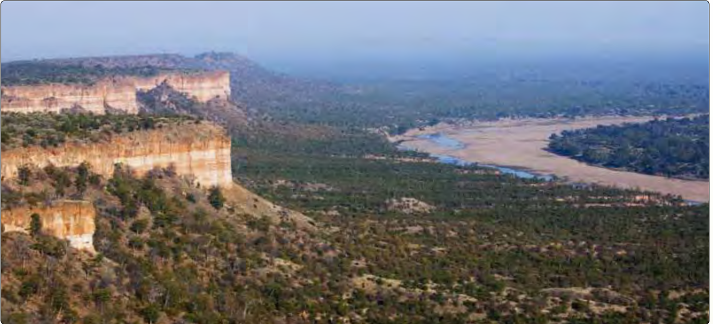
Die Sandsteinklippen von Gonarezhou.

mit ihre Effektivität ganz merklich steigern. Zum einen haben wir unser Flugzeug an der Hand, mit dem wir illegale Aktivitäten im Park aus der Luft aufspüren können, sodass die Rangereinheiten dann gezielt zu der Stelle vordringen können. Zum anderen wurden die Patrouillen allein dadurch intensiviert, dass wir die monatlichen Essensrationen für die Ranger bereitstellen. Denn wenn die Jungs keine Rationen für die Patrouillen haben, gehen sie auch nicht raus, so einfach ist das.