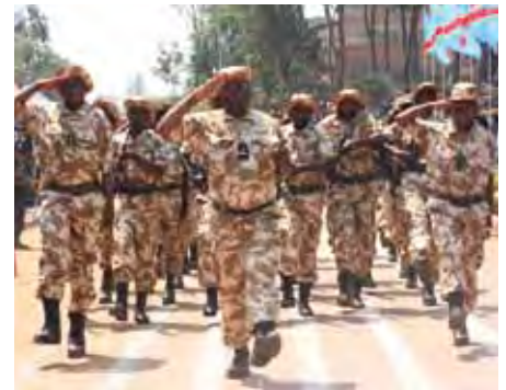
Die Ranger von Kahuzi-Biega führen ihre neuen Uniformen bei der Parade zum Unabhängigkeitstag am 30 Juni vor.

Uniformen sind für die Ranger von Nationalparks nicht nur praktische Berufsbekleidung, sie sind etwas, mit dem sie sich als Autoritäten ausweisen und zu erkennen geben. Gerade im Kongo, wo verschiedenste Rebellen- und Milizengruppen im Wald unterwegs sind, sind einheitliche Uniformen für die Ranger ein wichtiges Erkennungszeichen und damit sicherheitsrelevante Ausrüstung. Leider fehlen vielen Parks die Mittel, derartige Ausrüstung anzuschaffen. Die ZGF unterstützt daher an genau dieser Stelle und bisweilen bekommt sie dabei großzügige Hilfe. Die Mainzer