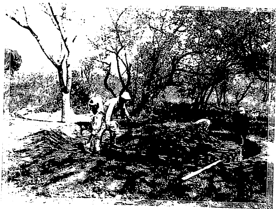
Bouwvakkers zijn bezig met de fundering van een rangerpost.