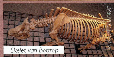
Skelet van Bottrop