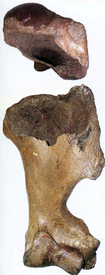
Knaagsporen aan de voorzijde van het linker opperarmbeen ontstaan door hyena's of leeuwen.