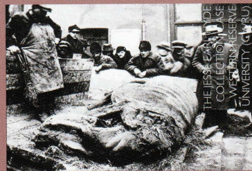
Karkas met huid van een wolharige neushoorn Coelodonta antiquitatus zoals deze gevonden is in het asfalt van de Starunia Oil Field, Polen, 1929.

Het skelet van Munster (Universitätsmuseum) heb ik kunnen bekijken in een voor mij geopende verhuiskist. Het skelet is een reconstructie van losse vondsten. Het skelet moet nodig worden verbeterd en gerestaureerd.