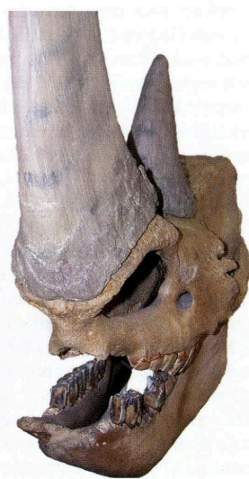
Foto's van de twee hoorns van een recente neushoornschedel (de zwarte neushoorn ( Diceros bicornis )) in het zoölogisch museum Amsterdam. Duidelijk te zien is de dikke huid en de vezelige structuur van de hoorn.