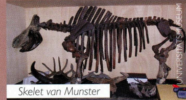
Skelet van Munster

imponeren en sneeuw opzij te schuiven zodat de dieren de onderliggende planten konden vinden. De wolharige neushoorn at vooral grassen, zoals blijkt uit de maaginhoud van bevroren kadavers uit de permafrost.