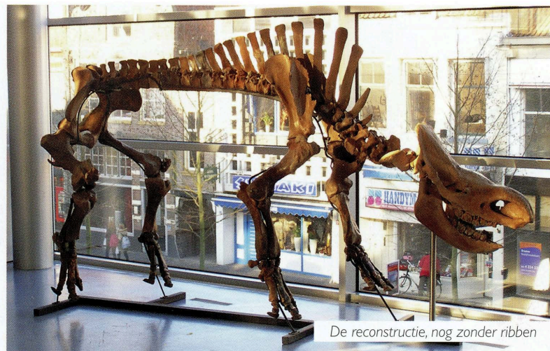
De reconstructie, nog zonder ribben

bijeen verzameld. Het skelet is toen tijdelijk geëxposeerd in het Stedelijk museum Zwolle. Maar een skelet zonder ribben is geen dikke wolharige neushoorn. Via Bottrop en Bielefeld ben ik in contact gekomen met het Naturmuseum Münster. Münster was op dat moment bezig met replica's van de neushoorn van Lahde. Zij hebben mij geholpen aan een set replica (kopie) ribben. Aanvullende informatie over de ribben heb ik gekregen van het museum in Krakow (P.), waar de Starunia neushoorn wordt geëxposeerd. Met deze set ribben heb ik eind 2009 de reconstructie van de wolharige neushoorn kunnen afronden.