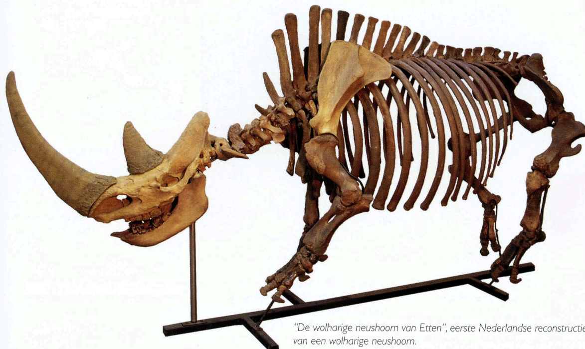
"De wolharige neushoorn van Etten", eerste Nederlandse reconstructie van een wolharige neushoorn.