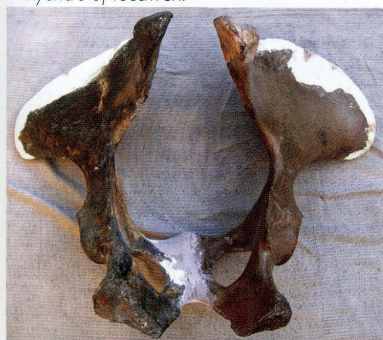
Twee gemonteerde bekenhelften na restauratie en voor het op kleur brengen.