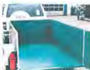
chemicaliën bestendig diverse laagdiktes