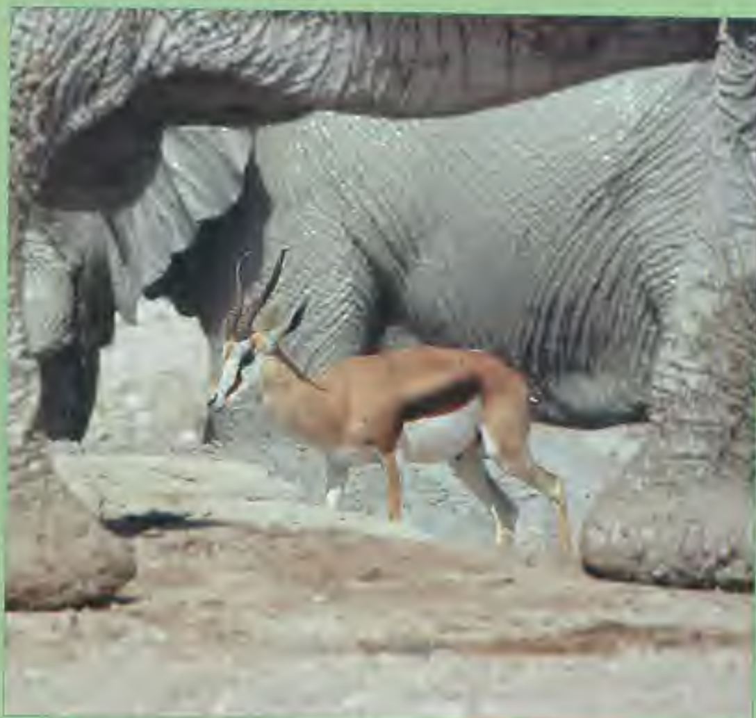
Springbok tussen de bifanten in Etosha National Park

We gaan terug naar de Oase, waar de boel 's avond nog eens flink op z'n kop wordt gezet tot in de kleine uurtjes. Somme reisgenoten leiden zelfs aan partieel geheugenverlies.