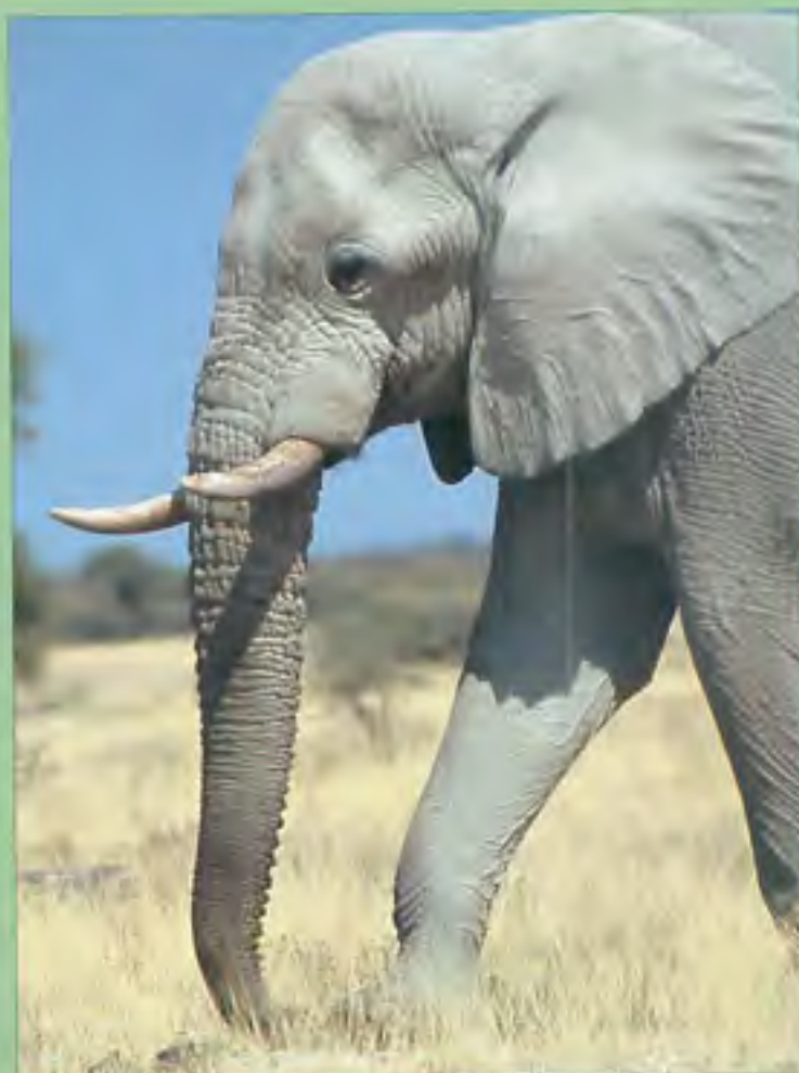
Olifant in Etosha National Park