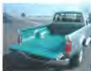
Anti-slip scheurt of breekt niet