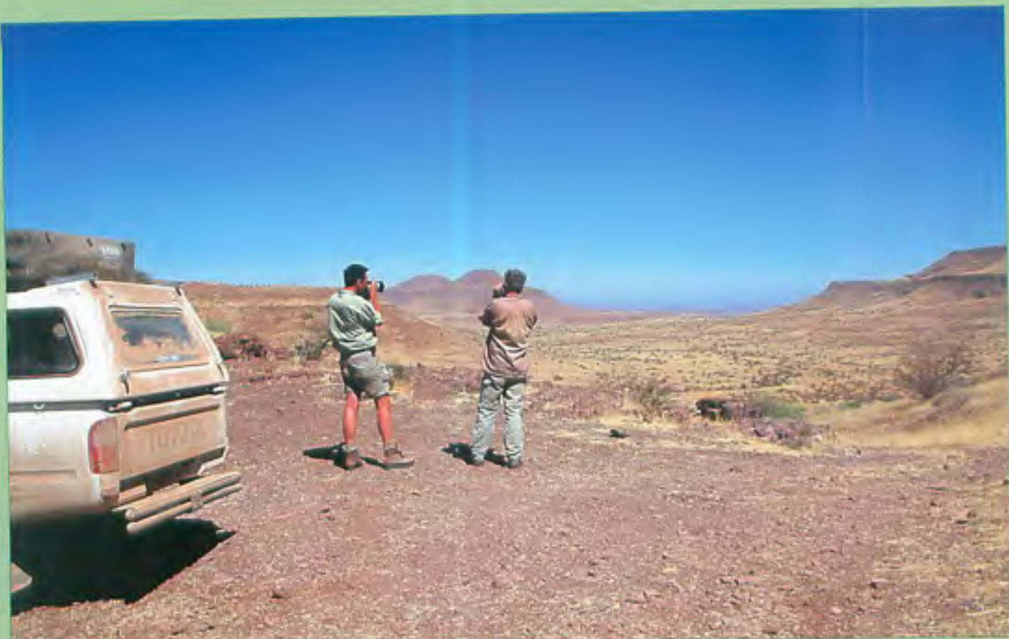
Op zoek naar zwarte neushoorns in Damaraland

In Windhoek gaan we nog een keer bij Joe's bierhuis eten. Zowel het vlees als de sfeer is hier geweldig, dat is echt een aanrader. Wel even reserveren want het is bijna iedere avond vol. Dat was een mooie afsluiting van de Rhino Expedition 2002. Een geweldige reis in een verbluffend mooi land.