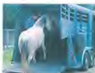
diverse kleuren leverbaar naadloos aanbrengen