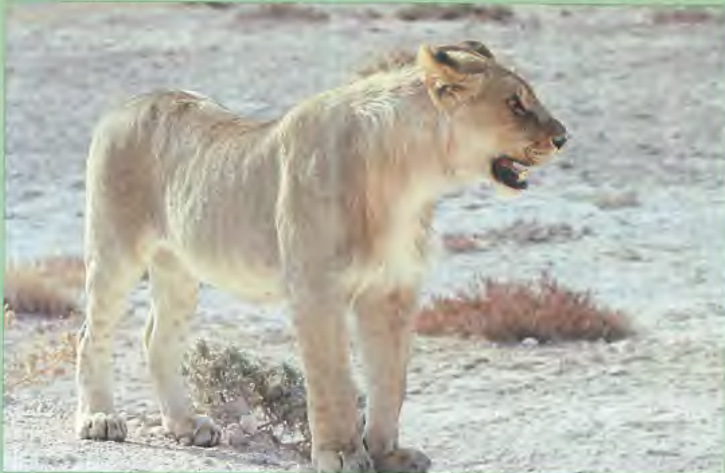
Leeuw in Etosha National Park

De barman -op leeftijd- heeft zichtbaar veel moeite om ons besteltempo bij te houden. 's Avonds vieren we Heroes Day met de plaatselijke bevolking, een bijzondere ervaring met veel Afrikaanse muziek waar de 'locals' geweldig op dansen.