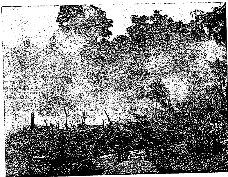
Fig. 94. Waar het oerbosch wijken moet; boschbrand ten behoeve van ladangbouw nabij Pendeng.

kosten en door op het einde van de tournee opgelopen voetblessures niets is gekomen. Het kwam mij daarenboven niet verantwoord voor een nog grooter deel van het mij ter beschikking staande bedrag te besteden aan een onderzoek in het reservaat. De Lösertocht, die slechts dertien dagen duurde, kostte mij reeds bijna vier honderd gulden!