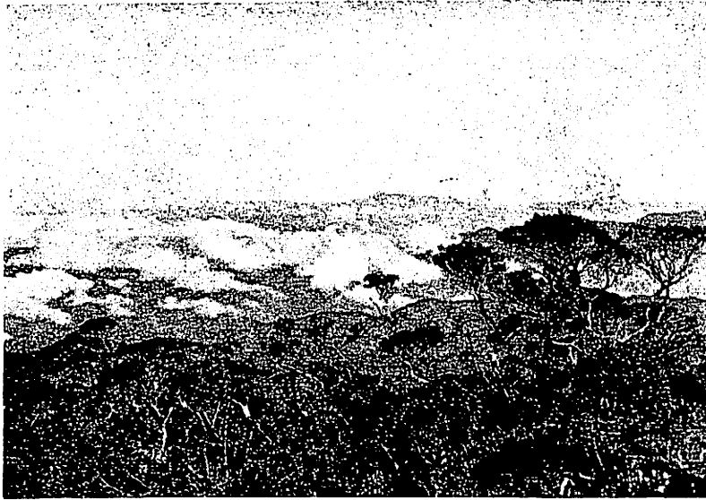
Fig. 86. Panorama onderweg naar de Löser-toppen.