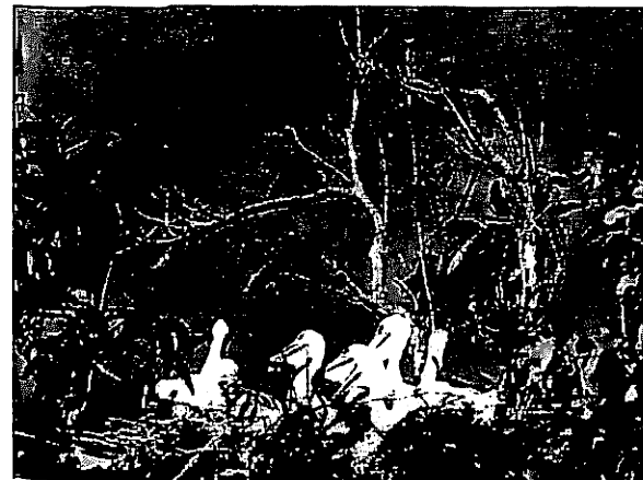
Nestlinge des Graupelikanes im Alter von etwa 4 Wochen.

taucht endlich eine kleine Insel von etwa 20 hohen Bäumen im Meer der Rohrhalme auf, und dort nisten die Pelikane hoch in den von ihrem Kot weißgekalkten Ästen. Wir umreiten die Bauminsel, es riecht ätzend nach Ammoniak, und die Luft rauscht vom schweren Flügelschlag der aufgeschreckten Vögel. Während wir die Bauminsel beobachten und die Pelikane sich allmählich wieder beruhigen und bei ihren Nestern einfallen, reißt RAIBAHADUR genußvoll ein Grasbüschel nach dem anderen aus, schlägt es sich polternd gegen die Beine, daß der Sand nur so herausfliegt, und stopft es sich behutsam ins Maul. Wir schätzen die Zahl der Pelikane auf 500. Etwa 160 Paare haben große Reisinester gebaut. Manche Alttiere brüten fest, andere Nester sind von wenige Tage alten, noch spärlich bedunten Jungvögeln besetzt, die meisten Jungvögel sind jedoch etwa vier bis fünf Wochen alt. Sie turnen recht waghalsig in den Baumkronen umher. Einer von ihnen hat sich weit auf einen dicken Ast vorgewagt, und als wir unter ihm hindurchreiten, spuckt er seinen angedauten, überriechenden Mageninhalt auf uns herab. Das kann uns jedoch nicht daran hindern, dieser luftigen Kinderstube noch so manchen weiteren Besuch abzustatten.