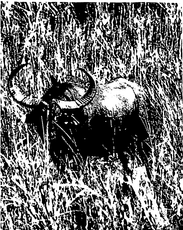
Ein Arnibulle sichert den Rückzug seiner Herde. Nur wenige Sekunden später erfolgt ein Scheinangriff.