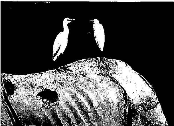
Kuhreihner haben sich auf dem Rücken eines Panzernashornes niedergelassen.

Auf jedem unserer Ritte hatten wir Graupelikane beobachtet, wie sie in kleinen Gruppen auf den Moortümpeln fischten oder über uns am Himmel ruhig segelnd ihre Kreise zogen. Der Forstbeamte hatte uns von einer Brutkolonie der Pelikane erzählt, die tief im Reservat läge, und so brechen wir eines morgens besonders früh auf und lassen uns von RAIBAHADUR zu den großen Vögeln tragen. Nach langem Ritt durch oft sechs Meter hohes Elefantengras