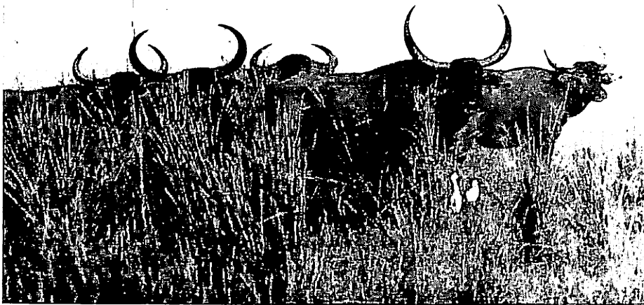
Aus dem Morgennebel taucht eine Arniherde auf. Sie besteht aus etwa 15 Tieren.