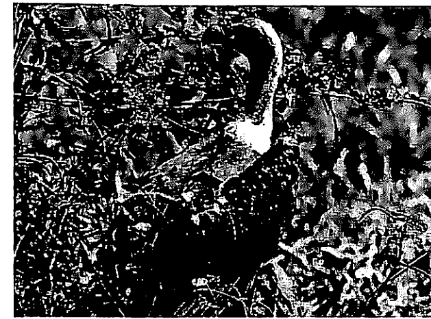
Bengalengeier im Randgebiet des Kaziranga-Reservates.

taucht endlich eine kleine Insel von etwa 20 hohen Bäumen im Meer der Rohrhalme auf, und dort nisten die Pelikane hoch in den von ihrem Kot weißgekalkten Ästen. Wir umreiten die Bauminsel, es riecht ätzend nach Ammoniak, und die Luft rauscht vom schweren Flügelschlag der aufgeschreckten Vögel. Während wir die Bauminsel beobachten und die Pelikane sich allmählich wieder beruhigen und bei ihren Nestern einfallen, reißt RAIBAHADUR genußvoll ein Grasbüschel nach dem anderen aus, schlägt es sich polternd gegen die Beine, daß der Sand nur so herausfliegt, und stopft es sich behutsam ins Maul. Wir schätzen die Zahl der Pelikane auf 500. Etwa 160 Paare haben große Reisinester gebaut. Manche Alttiere brüten fest, andere Nester sind von wenige Tage alten, noch spärlich bedunten Jungvögeln besetzt, die meisten Jungvögel sind jedoch etwa vier bis fünf Wochen alt. Sie turnen recht waghalsig in den Baumkronen umher. Einer von ihnen hat sich weit auf einen dicken Ast vorgewagt, und als wir unter ihm hindurchreiten, spuckt er seinen angedauten, überriechenden Mageninhalt auf uns herab. Das kann uns jedoch nicht daran hindern, dieser luftigen Kinderstube noch so manchen weiteren Besuch abzustatten.