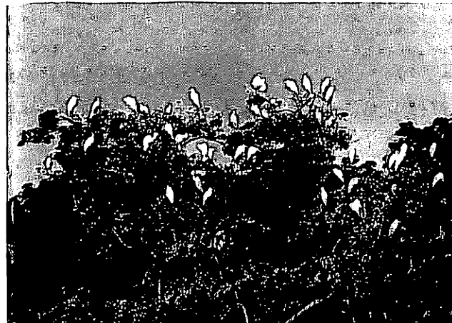
Einem blühenden Magnolienbaum gleicht der Schlafbaum der Kuhreiher aus der Ferne.