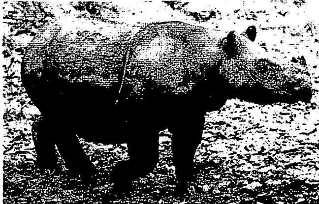
BADAK Sumbu Sumatera, spesies paling kecil di kalangan keluarganya kini menghiru sekitar hutan sempit Sabah.

Ini berhaluan, badak sumbu Sumatera merupakan spesies berkecil di dalam kategorinya yang turut mempunyai dua tanduk atau sumbu bagi