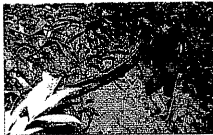
SALAH satu tempok bertukang yang telah dianggokkan badak sumbu.

Spesies yang dikenali sebagai mendiami kawasan paya tanah rendah Sabah dan hutan bukit tinggi ini turut dikategorikan sebagai Hawian Diancam Kepupusan Paling Kritikal oleh Perlistoran Antarabangsa bagi Pemuliharaan Alam Sekitar dan Sumber Semula Jadi (IUCN) 1996.