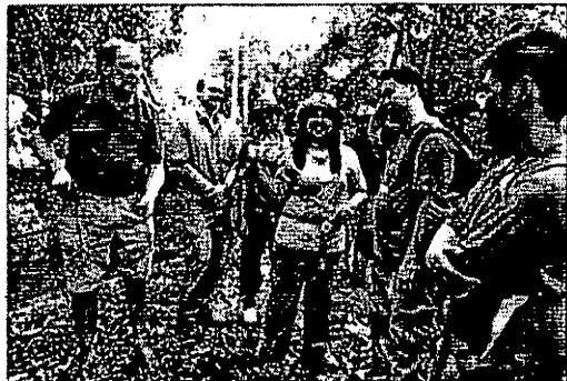
PARA penyokong gembira dengan pemuliharaan badak sumbu Sumatera di hutan. Setiap dengan pemuliharaan kesan tapak kaki hawian berkenaan.