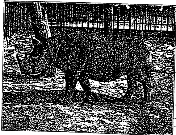
Deutsch-Ostafrikanisches Doppelnashorn ( Rh. bicornis L.)