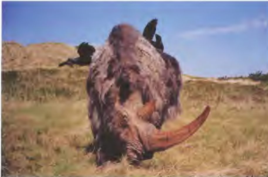
Afb. 8. Het uiteindelijke resultaat: het model van de wolharige neushoorn (aanzicht van voren), een echte grazer op een grasvlakte op Texel.