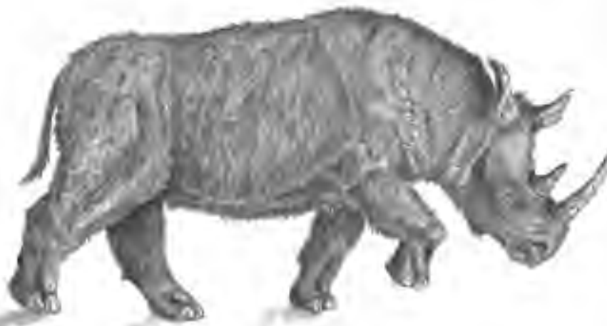
Afb. 12. De Midden-Pleistocene steppen-neushoorn ( Stephanorhinus hemitoechus ), een grazer. De steppen-neushoorn is nauw verwant met de nu nog voorkomende Sumatraanse neushoorn, Dicerorhinus sumatrensis . Tekening Ko Sturkop, 1996.

Loose, 1975; Guérin, 1980; Van Kolfschoten, 1980). Hij is een bewoner geweest van het savanne-biotop, een leefgebied dat gekenmerkt werd door graslanden met struikgewassen, afgewisseld door bossen. Dat is ook het leefgebied geweest van de zuidelijke mammoet ( Mammuthus meridionalis ), de stamvader van alle Euraziatische en Noord-Amerikaanse mammoeten. Zowel de zuidelijke mammoet als de etruskische neushoorn zijn 'browsers' geweest, zoals we kunnen afleiden uit hun laagkronige gebit dat uitstekend geschikt is voor het vermalen van zacht voedsel zoals bladeren, takjes en twijgen van bomen en struiken. Het blijkt ook uit de vorm van de schedel, die aangeeft dat de kop naar voren gericht is geweest (horizontale stand), in tegenstelling tot die van de grazende wolharige neushoorn, wat weer aangeeft dat het dier voedsel genuttigd heeft dat niet hoofdzakelijk van de grond komt. Ook de ledematen geven aan dat het een hoogbenige neushoorn geweest is.