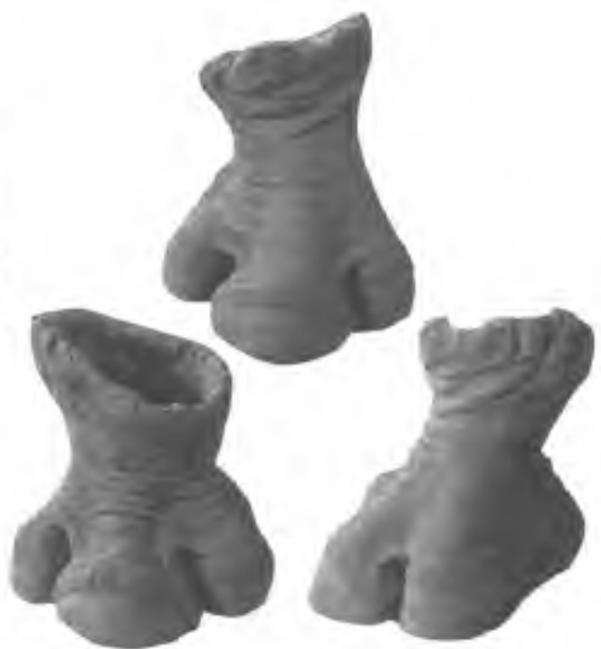
Afb. 7. De voeten van de wolharige neushoorn worden gekenmerkt door drie tenen (een onevenhoevige, Perissodactylia ) en zijn ten behoeve van het model vervaardigd uit klei, waarna zij in kunststof zijn afgegoten. Deze modellen zijn vervaardigd op basis van de fossiele overblijfselen die werden gevonden in de permafrost van Siberië. Deze figuur toont verschillende aanzichten van de linker- en rechtervoeten. Foto: Remie Bakker.

lei insecten en vegetatieresten uit hun biotoop. Omdat de Texelse wolharige neushoorn erg goed is uitgevallen wat betreft de beharing en daardoor zeker volgezeten heeft met insecten van de mammoet-steppe en net aan het verharen is, heeft Remie Bakker drie kraaien op de rug van het dier geplaatst. Gratis meereizen, gratis eten (insecten) en plukken wol stelend om nesten te bouwen. De reconstructie is immers, zoals reeds gesteld, een lente-moment. Dergelijke tafereelen kennen we ook van ossenpikkers die met recente neushoorns in Afrika meereizen.