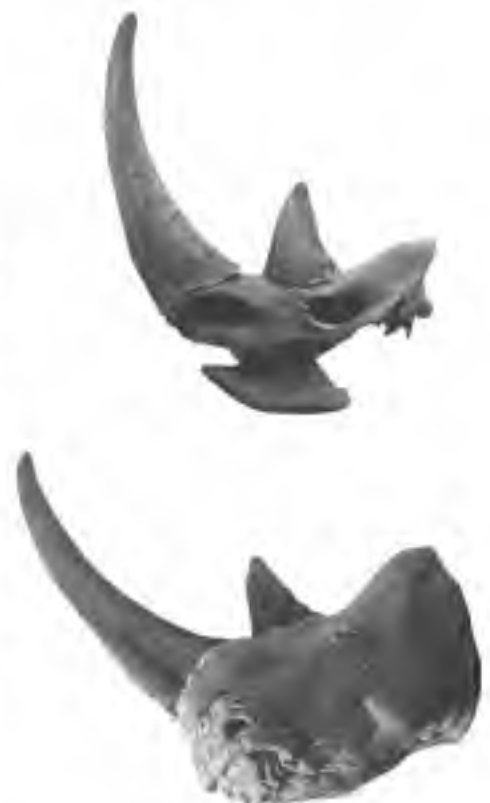
Afb. 5. Voor de kop van het model werd gebruik gemaakt van een kunststof afgietsel van de schedel van een vrouwelijk individu. Daarop zijn de nasale en de frontale hoorn, eveneens eerst uit klei gemodelleerd en daarna in kunststof afgegoten, gemonteerd (boven). Daarna zijn spieren en de huid op de schedel gemodelleerd (onder) die uiteindelijk met haar bekleed zijn.

Een ruw model werd vervaardigd uit polyurethaanschuim, dat zich makkelijk in een vorm laat snijden (Afb. 6). Zo ontstond als het ware een vorm van een neushoorn, maar dat was nog lang geen wolharige. De voor- en achterpoten zijn eerst uit klei gemodelleerd. Dat de wolharige neushoorn een drietenig dier is, komt in de reconstructie duidelijk tot uiting. De middelste teen is de breedste en wordt aan weerszijden begrensd door twee kleinere tenen (Afb. 7). De nagels