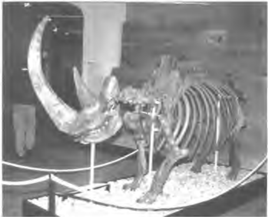
Afb. 3 Het skelet van een vrouwelijk individu de wolharige neushoorn ( Coelodonta antiquitatis ) dat gevonden werd in Chirapachi (Jakutië), schuin van voren gezien op een tentoonstelling in het Hessisches Landesmuseum te Darmstadt (Duitsland). Let op de extreem lange nasale hoorn (130 cm) en de veel kleinere frontale hoorn.

Een goed beeld van de uiterlijke verschijning van de wolharige neushoorn krijgen we door de grottschilderingen, in o.a. de grot van de mammoeten in Rouffignac en de grot van Chauvet, beide in Frankrijk. Naast de grottschilderingen weten we veel over de uiterlijke verschijning van de wolharige neushoorns door een aantal opmerkelijke vondsten in de eeuwig bevroren bodem (permafrost) van Siberië en de Oekraïne. Naast de harde skeletdelen zijn ook zachte delen bekend, zoals de huid en de beharing, maar ook de uit keratine (hoornstof) bestaande nasale en de zeldzamere frontale hoorns.