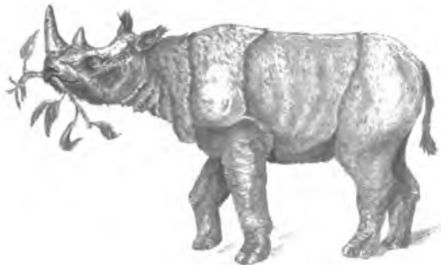
Afb. 10. De Vroeg-Pleistocene etruskische neushoorn ( Stephanorhinus etruscus ), een bladeter ('browser'). Tekening van Ko Sturkop, 1996.

Uit het Pleistoceen van Nederland en de aangrenzende Noordzee zijn nog