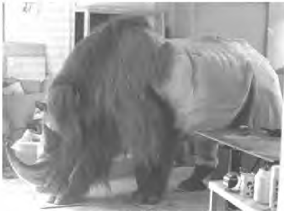
Afb. 6. De romp van het model is vervaardigd uit polyurethaanschuim dat zich makkelijk laat bewerken. Daarover heen werd een haarkleed aangebracht. De wollige ondervacht werd pas later aangebracht. Foto in het atelier van Manimal Works in Rotterdam.

zijn mooi rond gemaakt; dat is gebaseerd op een droge ondergrond. Bij een zeer vochtige ondergrond, zoals die bijvoorbeeld bestaat op een in de zomer ontthoofde toendra, zouden de nagels immers veel langer zijn geweest. Over het goedgekeurde ruwe schuimmodel werd een laag polyester (de huid van de neushoorn) aangebracht waarop de 'fur' en 'underfur' werd gelijmd (Afb. 6). Voor de haarkleuren werd gekozen voor een grijsbruine kleur met hier en daar donkere kleurschakeringen. Eén en ander is gebaseerd op de vachtresten van de wolharige neushoorn die gevonden zijn in de permafrost van Siberië. Deze zijn doorgaans bruinrood van kleur, maar dat komt vermoedelijk omdat er veel pigment verloren gaat bij blootstelling aan licht. Datzelfde is al vaker geconstateerd bij de haren van de wolharige mammoet. Bij het opgraven zijn deze zeer donker van kleur, vaak bij het zwarte af, maar verkleuren tot bruinrood en soms geel, als zij langere tijd aan het licht blootgesteld zijn. Om te voorkomen dat de vacht in het model te regelmatig zou worden, zijn er plukken 'underfur' aangebracht die de indruk wekken dat het dier aan het verharen is. We gaan er van uit dat er een duidelijk onderscheid is tussen de winter- en de zomervacht. Onze wolharige neushoorn is dus een reconstructie die geplaatst moet worden aan het einde van de lente. In recon-