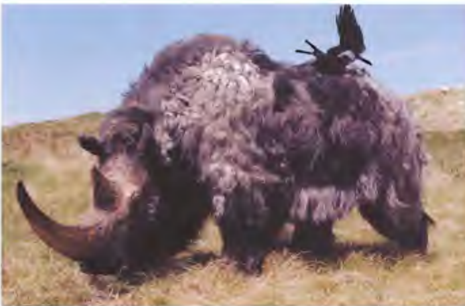
Afb. 9. Als Afbeelding 8, zij-aanzicht.

haarkleed voorzien, echter korter dan de vacht op bijvoorbeeld de rug en de schouders. Ook deze informatie werd verkregen door bestudering van een schedel met huid en haar uit de bodem van Siberië, een exemplaar in de tentoonstellingen van het Zoologisch Museum in Sint-Petersburg. Uiteindelijk is er een vrouwelijke wolharige neushoorn ontstaan met een schofthoogte van 165 cm en een lengte van 286 cm. (Afb. 8 en 9). Dus niet ruim drie meter lang zoals eerder gesteld, maar dat komt omdat het dier enigszins gedraaid is opgesteld, waardoor de lengte van de staart tot aan de kop korter uitvalt. Als