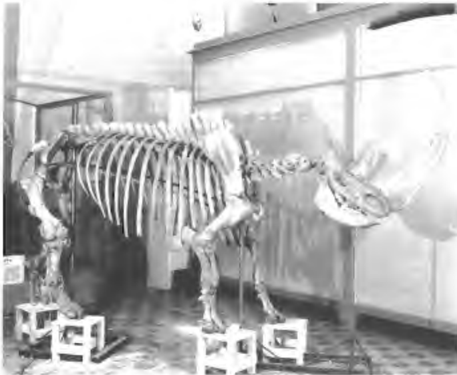
Afb. 4. Hetzelfde skelet van de wolharige neushoorn als in Afbeelding 3, hier tijdens de montage in het Zoologisch Museum van Sint-Petersburg (Rusland), zij-aanzicht.

en daarover heen een vacht van lange dikke haren, aangeduid als "fur". Van delen van de kop weten we dat de bovenlip extreem breed is geweest, vergelijkbaar met die van de recente witte neushoorn ( Ceratotherium ) in Afrika, die ook als een grazer beschouwd wordt (Afb. 2). En dan zijn er de complete hoorns uit de permafrost; veel gevonden worden die niet. Deze hoorns zijn zeer karakteristiek. De nasale hoorn is, in tegenstelling tot die van de recente neushoorns, lateraal afgeplat en aan de voorzijde vaak kaarsrecht. Dit werd veroorzaakt doordat de wolharige neushoorn de voorste hoorn gebruikte als een soort veger over de droge bodem met de harde vegetatie, waardoor de keratine hoorn aan de voorzijde gemakkelijk kon afslijten. De langste frontale hoorn die ooit gevonden is in Siberië, meet 130 cm. De uit de permafrost bekende frontale hoorns hebben aan de basis een veel rondere omvang dan de nasale hoorns.