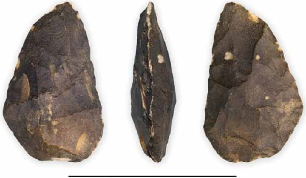
Fig. 1 Vuistbijl vervaardigd uit vuursteen van de vindplaats De Grote Wielen. Baggerschip "Den Otter", november 2009. Diepte: -10 meters beneden ANP. Collectie: Paleontologisch-Archeologisch Museum Hertogsgemaal, 's- Hertogenbosch. Maatstreef: 10 cm.

kunnen door deze zuiger met gemak worden losgewoeld en opgezogen, waarna een zuigpijp en een perspijp het losgewoelde sediment, zand en grind naar een zanddepot spuiten.