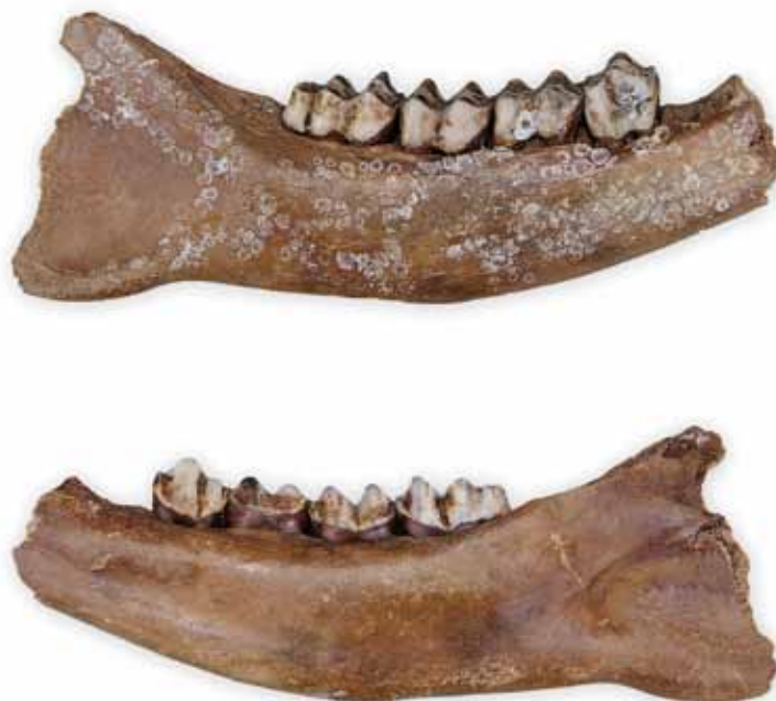
Fig. 3 Fragment van de rechter onderkaak met de gebitselementen p4 en m1-m3 (mandibula dext.) van het rendier, Rangifer tarandus . Vindplaats: Draaicirkeel in Eurogeul voor de kust van Zuid-Holland, juli 2010. Leg.: Bemanning OD 7. Collectie: Dick Mol, Hoofddorp. Maatstrep: 10 cm.