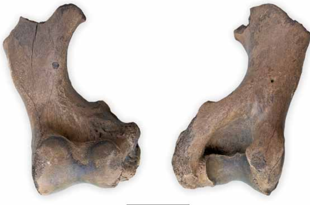
Fig. 4 Fragment van een linker opperarmbeen (humerus sin.) van een wolharige neushoorn, Coelodonta antiquitatis (BLUMENBACH, 1799). Vindplaats: De Groote Wielen, 's-Hertogenbosch. Baggerschip "Den Otter", 25 Maart, 2009. Diepte: -10 meters beneden ANP. Collectie: Paleontologisch-Archeologisch Museum Hertogsgemaal, 's- Hertogenbosch. Links: vooraanzicht (cranial). Rechts: achteraanzicht (caudal). Maximale breedte: 17 cm. Maatstrep: 10 cm.