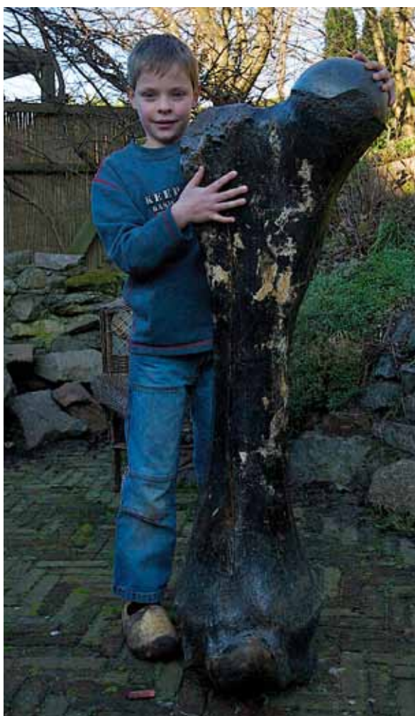
Fig. 2 Een fraaie bijvangst van de boomkorvisserij: een opgevisht dijbeen van een Laat-Pleistocene bosolifant, Elephas antiquus . Collectie Kommer Tanis, Havenhoofd, Stellendam.

Kleinere schepen, zoals de zogenoemde Eurokotters (schepen met een motorvermogen van minder dan 300 PK een lengte tot ongeveer 22 meter die binnen de 12 mijlszone mogen opereren) brachten vaak grote complete skeletdelen aan land en die bleken ergens uit de monding van de Westerschelde en voor de kust van Zuid-Holland vandaan te komen. Aan het begin van de negentiger jaren begonnen deze Eurokotters te vissen in de Eurogeul. In die Eurogeul wordt sinds de tachtiger jaren van de vorige eeuw intensief gebaggerd om de vaarroute naar Rotterdam op diepte te houden en bij deze baggeractiviteiten worden Holocene en Pleistocene sedimenten aangesneden. Grote hoeveelheden hout, fossiele beenderen en vette grijze klei passen niet in