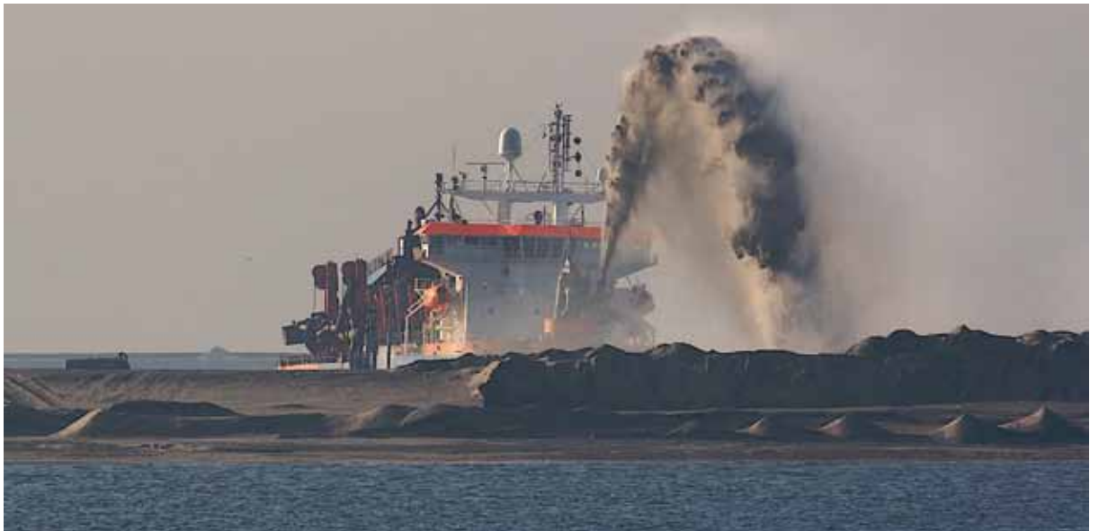
Fig. 19 240.000.000 kubieke meter sediment, grotendeels uit het Laat-Pleistoceen, van het Eurogeul gebied is van groot belang voor een betere kijk op de Mammoetfauna en de vroege bewoning van Nederland en de aangrenzende Noordzee.