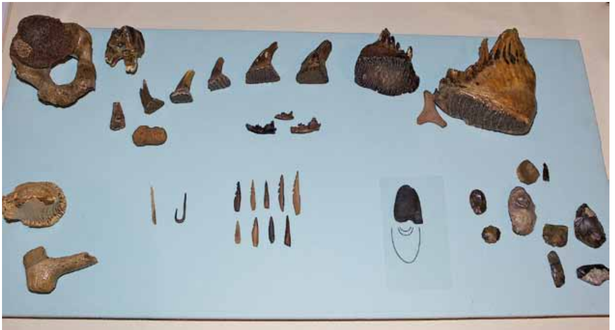
Fig. 16 Een deel van de collectie "strandvondsten" van Theo Dijkstra, Schiedam. Dit zijn over het algemeen kleine vondsten die vooral gedaan worden in het zand van de opgespoten stranden van Rockanje/Oostvoorne, maar ook bij Hoek van Holland en bij Scheveningen.

2/ De volgende mariene zoogdieren uit het Laat-Pleistoceen zijn in het Eurogeul gebied aangetroffen: baardrob ( Erignatus barbatus ), beloega ( Delphinapterus leucas ), grijze walvis ( Eschrichtius robustus ), ringelrob ( Pusa hispida ), walrus ( Odobenus rosmarus ) en zadelrob ( Phoca groenlandica ). De tot nu toe bekende dateringen variëren tussen 27.510 en > 47.500 BP (Mol et al , 2008).