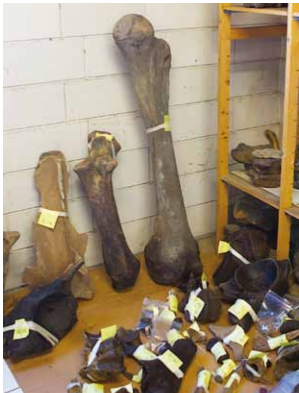
Fig. 14 Oktober 2009: Een deel van de opgekorte beenderen, voorzien van vondstgegevens, in het laboratorium te Urk. Deze vondsten zijn opgenomen in de collectie van het Natuurhistorisch Museum van Rotterdam.