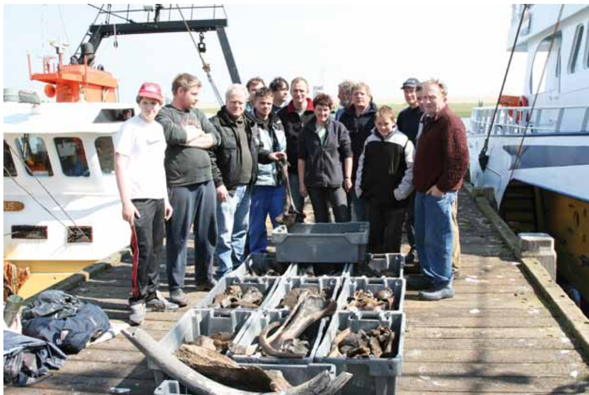
Fig. 6 Bij terugkomst in de haven van Stellendam op 3 mei 2008: Deelnemers van een succesvolle Eurogeul expeditie met de OD 7.

Gelijktijdig met de GO 33 hebben ook de eurokotters TH 7 (o.a. een complete onderkaak van een wolharige mammoet) en de OD 9 (o.a. een groot deel van een schedel met alveolen en waaraan de grote slagstand van onze expeditie toebehoort van een wolharige mammoet) in de Eurogeul gevist en hebben bijvangsten gehad die door ons verworven zijn. In totaal zijn 14 (!) kisten met fossiele beenderen en