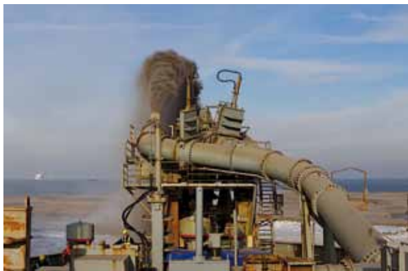
Fig. 18 Sleehopperzuiger volop in actie: het nieuwe land wordt al zichtbaar en bestaat uit Laat-Pleistoocene sedimenten uit het zandwingebied dat grenst aan de Eurogeul. Een nieuw "El Dorado" voor WPZ-leden.

de recente klapmuts ( Cystophora cristata ). Dat is vreemd, want alle overige recente subarctische zeehonden komen hier wel in het Laat-Pleistoceen voor. Wat kan daar de oorzaak van zijn?