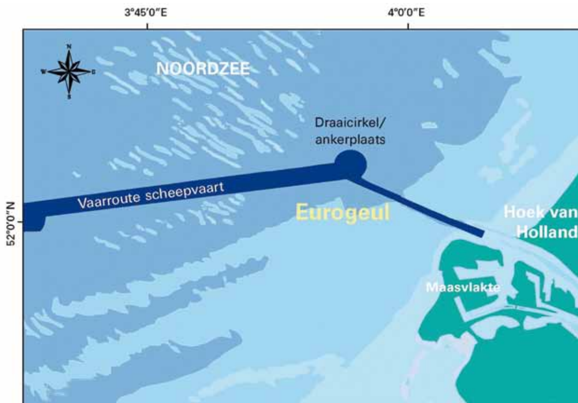
Fig. 1 De locatie van de Eurogeul voor de kust van Zuid-Holland.