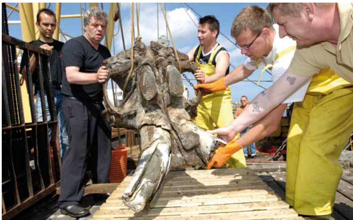
Fig. 4 Schedel van een wolharige mammoet, Mammuthus primigenius . Opgevestigd in de draaicirkel van de Eurogeul. Collectie Klaas Post, Urk.