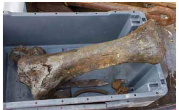
Fig. 9 Het scheenbeen in een viskist.

De OD 7 wordt door ons opnieuw ingehuurd om een etmaal voor de wetenschap te vissen. Uiteraard in hetzelfde