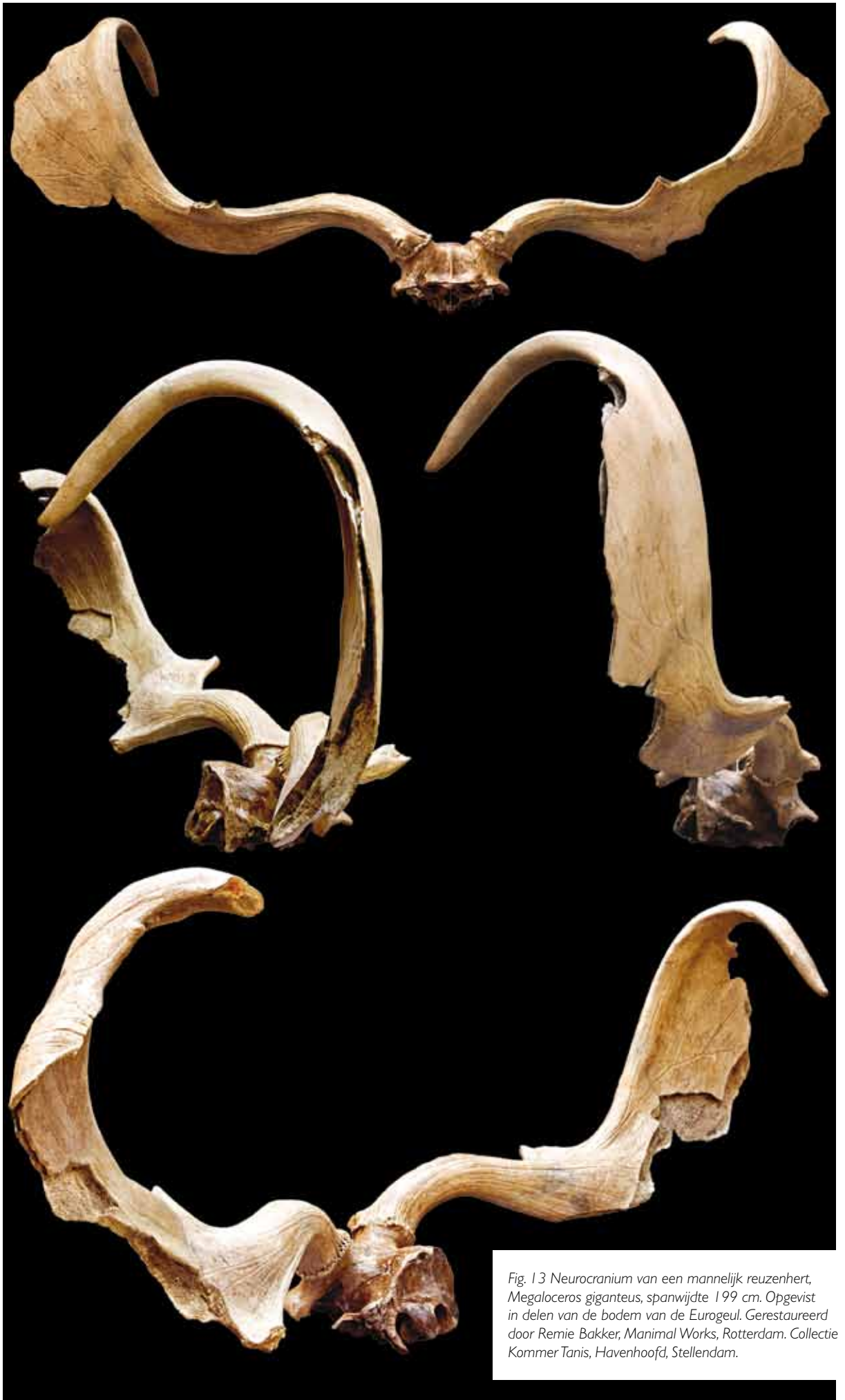
Fig. 13 Neurocranium van een mannelijk reuzenhert, Megaloceros giganteus , spanwijdte 199 cm. Opgevist in delen van de bodem van de Eurogeul. Gerestaureerd door Remie Bakker, Manimal Works, Rotterdam. Collectie Kommer Tanis, Havenhoofd, Stellendam.