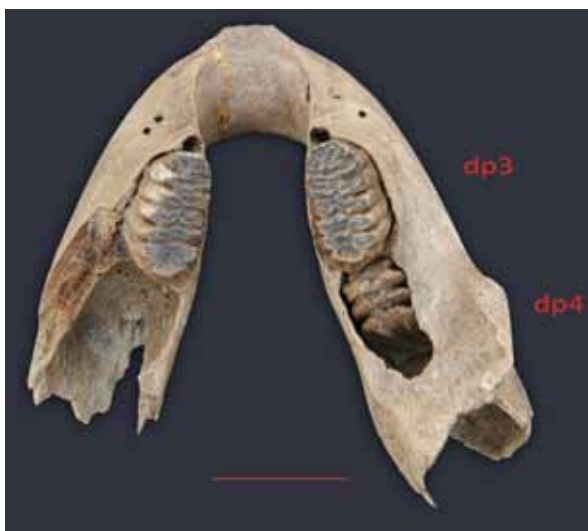
Fig. 11 Onderkaak van een jonge wolharige mammoet met de gebitselementen dp3 (links en rechts) en dp4 (rechts), opgevist in de Eurogeul. Links: zijaanzicht van voren gezien. Rechts: aanzicht op het kauwvlak. Collectie Klaas Post, Urk. Maatstreep: 5 cm.