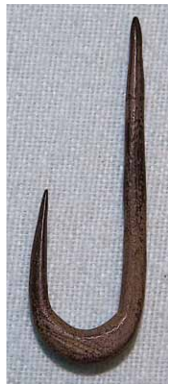
Fig. 17 Een 6 cm lange vishaak, vervaardigd uit bot, uit het Vroeg-Holoceen. Strandvondst Rockanje/Oostvoorne. Collectie Theo Dijkstra, Schiedam.

10/ Eurogeul fossielen zijn doorgaans gaaf en schoon maar enkele fossielen vertonen conglomeraten van zand, grind, houtresten en (vele) schelpen. Hoewel deze fossielen zelf tot in de puntjes bewaard zijn gebleven, blijkt de molluskenfauna voornamelijk te bestaan uit vermoedelijk verspoelde kust nabije Eemien fossielen die gemengd zijn met andere vreemde elementen (zoetwater slakken en dieper water soorten) (Wesselingh, 2008).