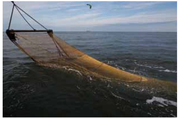
Fig. 7 Wat zit er in het net van de boomkorkotter als die in de bak aan boord geleegd wordt?

Er is de afgelopen herfst, winter en voorjaar intensief gebaggerd op de Eurogeul. Verschillende kleine kotters hebben – op jacht naar platvissen – er af en toe hun geluk beproefd en rapporteren goede bijvangsten uit het Pleistoceen en Vroeg-Holoceen. Wij besluiten dat het de hoogste tijd is om zelf weer een intensieve vistocht voor de zoogdierpaleontologie te organiseren. Het ons zo vertrouwde schip de GO 33 is nog actief in Het Kanaal en heeft een Franse haven als tijdelijke thuishaven gekozen. Het is te kostbaar om even voor