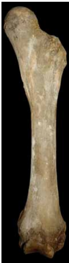
Fig. 15 Mammuthus primigenius , wolharige mammoet. Linker dijbeen. Lengte 133 cm. Het grootste dijbeen van een wolharige mammoet, ooit gevonden in Nederland. Opgevest tijdens de expeditie uitgevoerd in opdracht van het Havenbedrijf van Rotterdam. Collectie Natuurhistorisch Museum, Rotterdam.