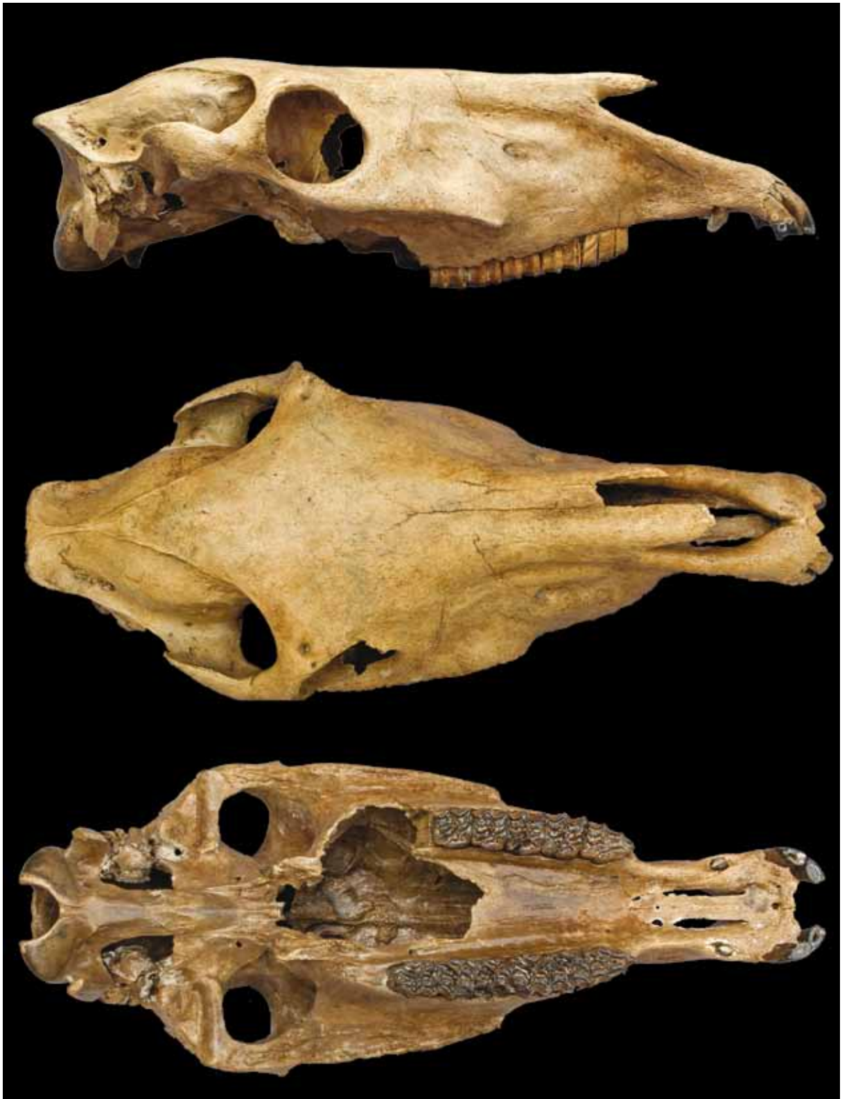
Fig. 12 Cranium van een wild paard, Equus caballus . Europeul. Zij- boven- en onderaanzicht. Lengte 56 cm. Collectie Kees Breeman, Stellendam.