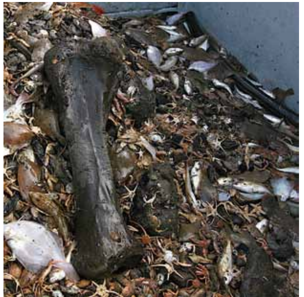
Fig. 8 Een hoeveelheid sediment, platvis, schelpen en een scheenbeen van een wolharige mammoet.