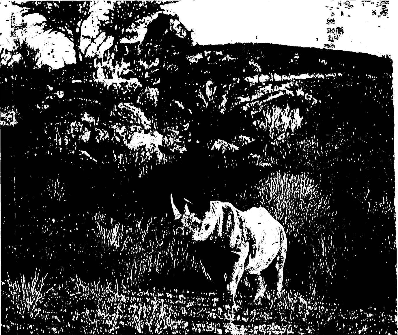
Die Etosha swart renosters het hulle goed aangepas by die plantegroei van Augrabies.

Augrabies het toe sy swart renosters 'n jaar gelede gekry. Die dramatiese vangoperasie in die Nasionale Etosha Wildtuin van Suidwes Afrika is vlink gedaan deur die wildvangspan van die Direkoraat Natuurbewaring. Die vervoer van die ses diere op die lang pad vanaf Otjovasandu tot in die Augrabies Waterval Nasionale Park het ook goed verloop. Die SAUK het 'n program wat uitgesaai is op 50/50, die operasie wyd bekendgestel. So ook, het 'n hele reeks koerantverslae en artikels in verskillende tydskrifte verskyn.