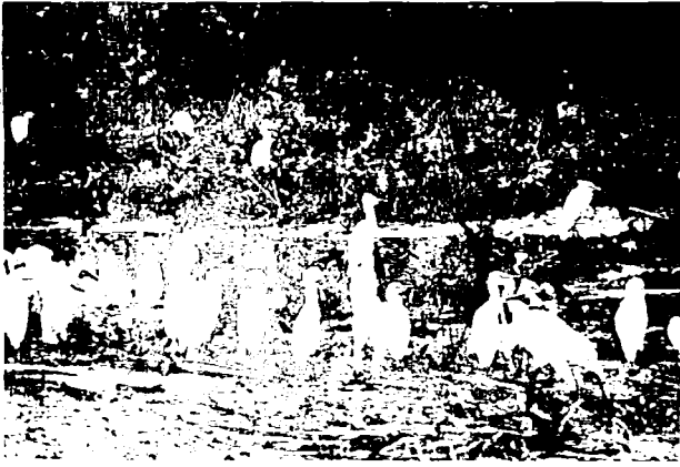
In een groot deel van Burundi zijn de koereigers ( Bubulcus ibis ) vrij talrijk.

spreken van de ivoersmokkel (de olifant is bijna uitgestorven in Burundi).