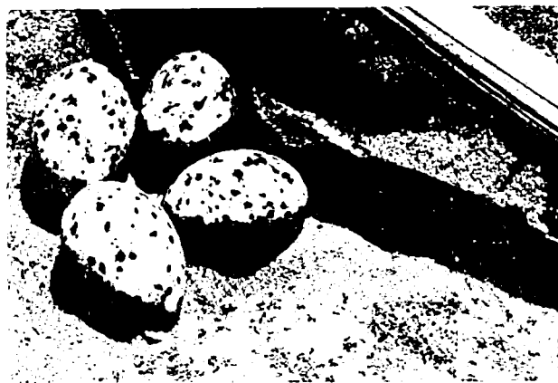
Bijzonder interessante vogels nestelen in de vlakte van de Rusizi: eieren van schaarbekken, Rynchops flavirostris .

worden, een laatste getuige, nog gedeeltelijk intact (maar wel bedreigd door roofofbouw) van het oorspronkelijke uitzicht van de vlakte. Enkele tientallen nijlpaarden zijn er regelmatig te zien; vogelkolonies, waaronder de Rynchops , nestmakende schaarbekken, bezoeken er de zandbanken. Enkele krokodillen van zeer grote afmetingen zijn er nog voorhanden. Men ziet ze vrij regelmatig.