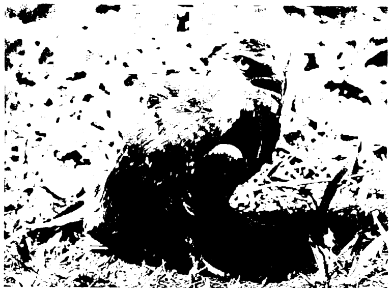
Jonge wouw, kleine roofvogel, heel vaak te observeren tegen de hemel boven Bujumbura.

Het samenstellen van een ploeg natuurbewerkers en gewapende wakers is prioritair : ja, wakers gewapend met een geweer, want ze nemen grote risico's. Het zijn dikwijls de beste dienaren van de staat, zoals de dertig of veertig wakers van Zaïre, heldhaftig gestorven « voor de olifanten », het hebben aangetoond. Excuseer de sterke uitdrukking : « Beter een dode stroper dan een dode waker ! » De wetgever zou tijdelijk alle jacht moeten verbieden gedurende minstens vijf jaar, om de wildstand toe te laten weer op peil te komen. Verscheidene Afri-