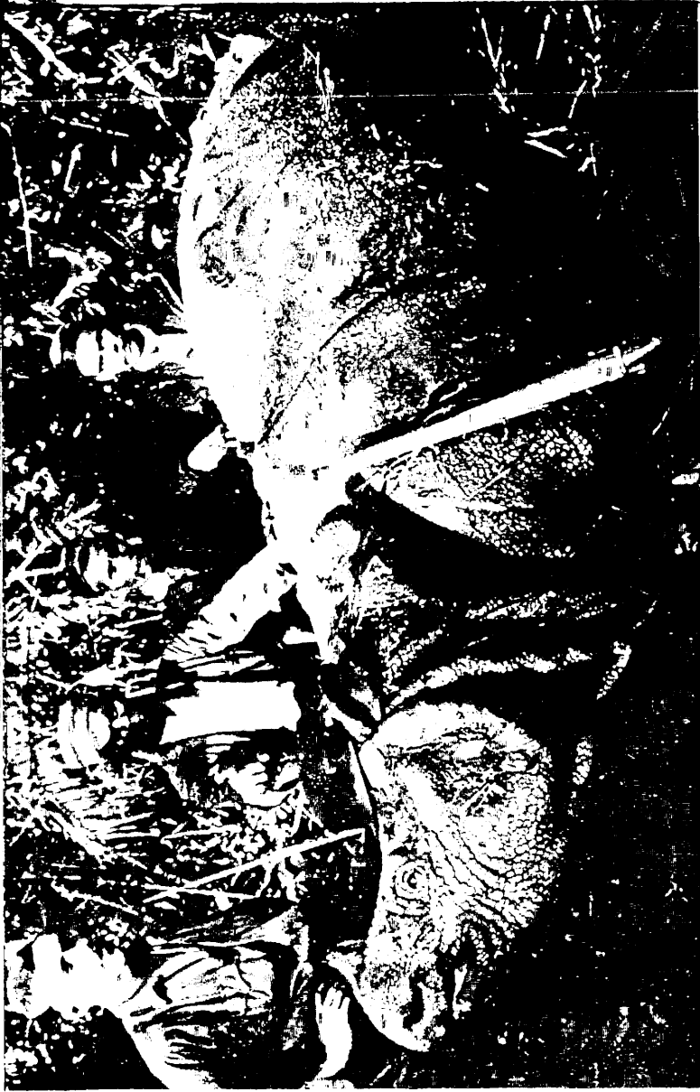
Badak, Sumatraanse rhinoceros, neer- gelegd in de Gajohlanden.