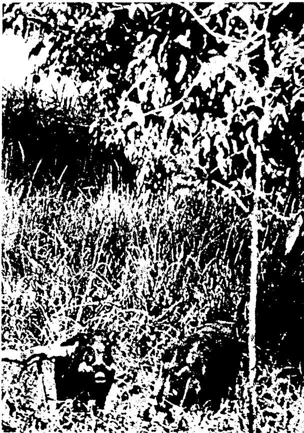
Wilde zwijnen in de alang-alang.