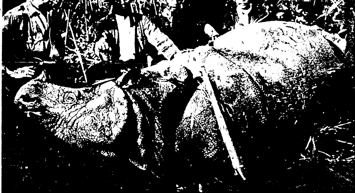
Badak. Sumatraanse rhinoceros, neergelegd in de Gajohlanden.