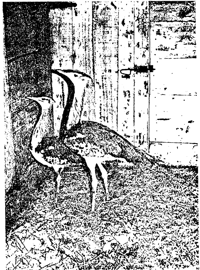
Afrikaanse Koritrap of reuzetrap (links ♀; rechts ♂) aangekomen in Planckendael op 10.10.85.

Natuurlijk werden beschermingsmaatregelen getroffen. Zo bestaan er 8 «sanctuaries» in Indië en 1 in Nepal. Op stroperij worden dure boeten gesteld en anderzijds worden beloningen uitgelooft voor inlichtingen die kunnen leiden tot de aanhouding van stropers. Deze maatregelen hebben inderdaad geleid tot een spectaculaire daling van de stroperij in Nepal.