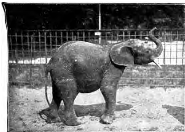
Junger Elefant aus Kamerun ( Elephas cyclotis Mtsch.)