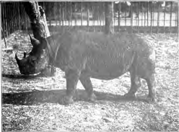
Deutfdi-Oftafrikanifches Doppelnashorn ( Rh. bicornis L.)