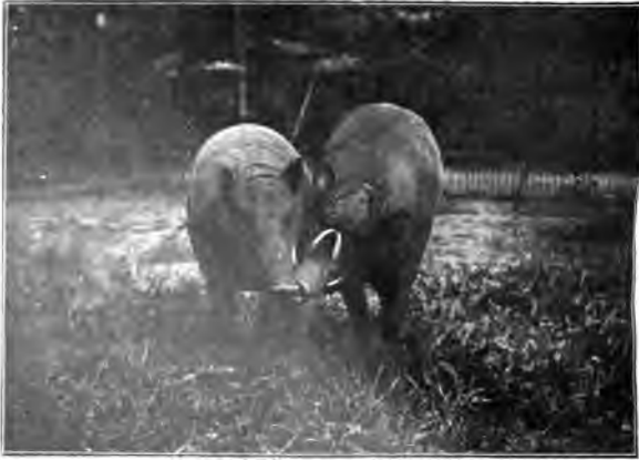
Birfcheber ( Babirussa babirussa L.)