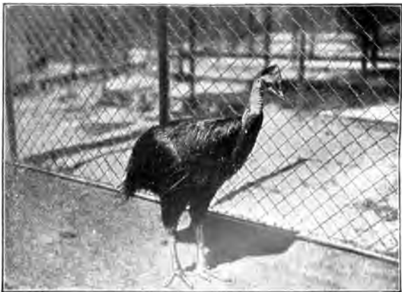
Bennets-Kaiuar ( Casuarus bennetti Gould). aus dem Bismarck-Bräuipel.