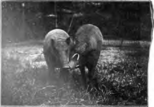
Birfcheber ( Babirussa babirussa L.)