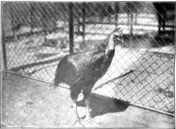
Bennets-Kaiuar ( Casuarus bennetti Gould), aus dem Bismarck-Archipel.