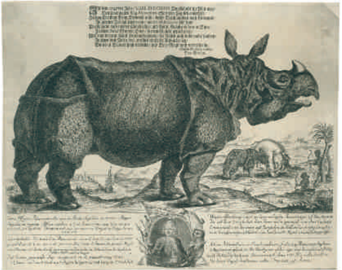
Afb. 2 [H. OSTER naar A.A. BECK], Waare Afbbeelding van een leevendighe Renoceros of Naashooren... , 1747. Gravure. Rijks- prentenkabinet, Rijks- museum, Amsterdam (FM 3786, inv.nr. RP-P-OB-75362).

Uit het computersysteem bleek gelukkig dat het museum ook nog een album met schetsen van onder meer een neushoorn heeft, maar wat daar precies in zou kunnen staan, was een verrassing. In de literatuur heeft dit album, dat 69 bladen telt, tot nu toe geen aandacht gekregen. Het is ooit toegeschreven aan de Venetiaanse kunstenaar Lorenzo Baldissera Tie-